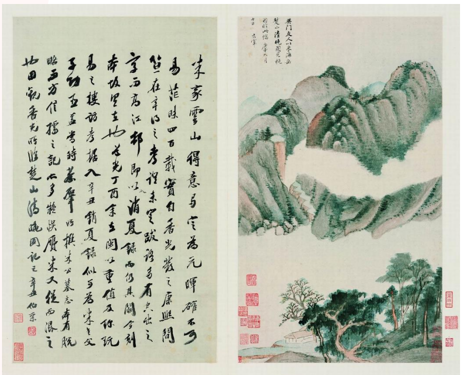
明 董其昌 秋興八景圖冊