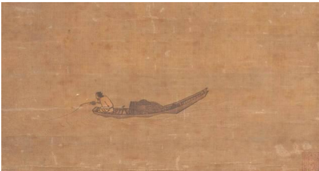
寒江獨釣圖軸 典藏者 東京國立博物館 傳馬遠繪。