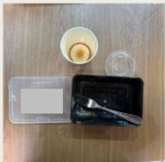
描述：3月1日 吃光食物 不浪費 by 1E 18