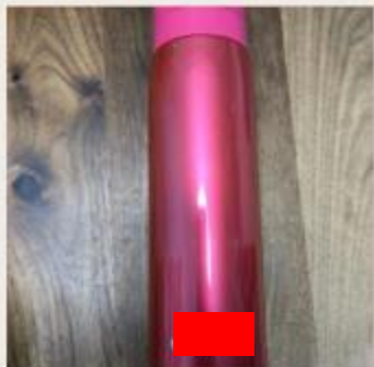
描述：3月5日 自備水瓶 重複使用 by 1E 12