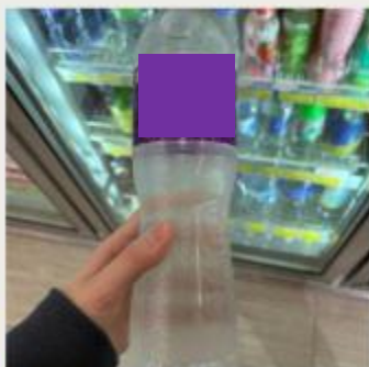
描述：3月1日 購買循環再造物料產品 環保選購 by 1E 18