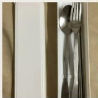
描述：3月5日 自備餐具 重複使用 by 1E 08