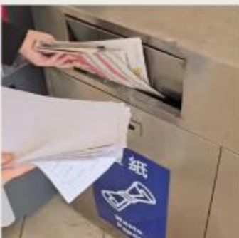
描述：3月2日 把用過的紙丟回收箱 循環再造 by 1E 21