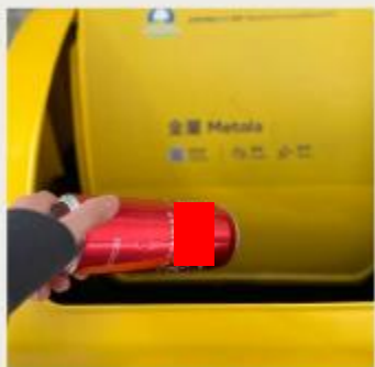
描述：3月1日 回收鋁罐 循環再造 by 1E 18