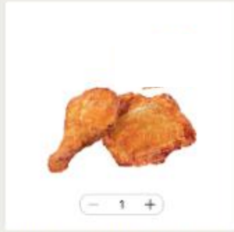
描述：3月1日 先點一份炸雞 不浪費 by 1E 18