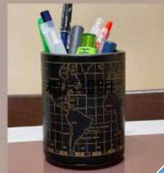
把不要的鐵罐用來 當筆筒重用。 Reuse