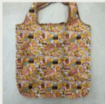
描述：3月5日 購買環保袋 重複使用 by 1E 18