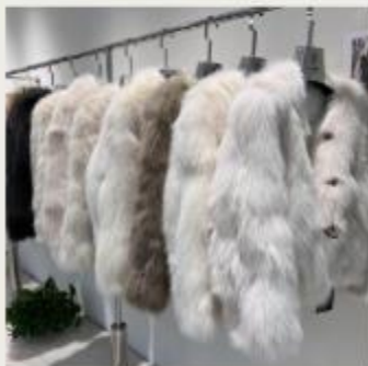
描述：3月5日 不購買皮革 保護自然 by 1E 18