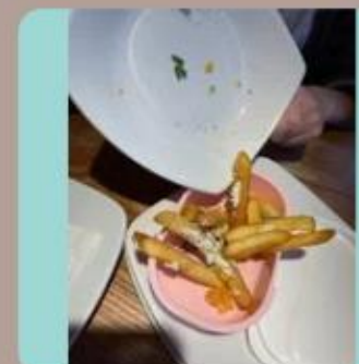
在食肆吃完多餘的食物 放進自己食物盒帶回家 Reduce