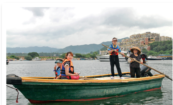
▲安排探訪水上人家的親子活動，讓學生親身體驗書中人物搖櫓的感受。