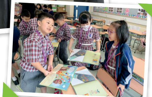
▶學生定期進行延展閱讀，以小組形式交流閱讀心得。

動機及提升閱讀能力。我們與家長共同規劃不同類型的閱讀活動，如夜探螢火蟲讀書會、夜宿圖書館、家長讀書會等。這些閱讀活動更與跨課程閱讀主題緊密連繫，豐富學生閱讀經歷之餘，更深化對相關主題的認識。例如親子讀書會配合四年級其中一個單元舉辦「水上人家」活動，學生實地了解大埔三門仔水上人的生活方式、謀生技能及習俗等，並與漁民進行訪談，進一步認識本港漁業的今昔、漁民生活的變化。學生能在真實情境中，深化閱讀所得，體會水上人堅毅的精神，從而一起探討如何把這種獨特的漁村文化繼續保存及延續下去。