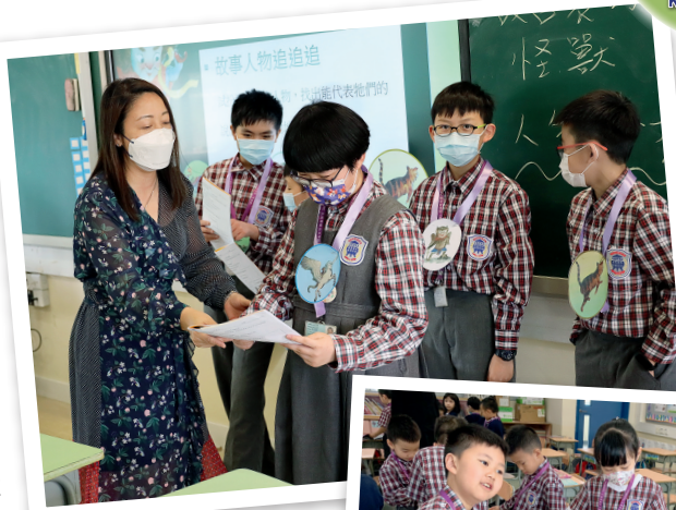
▲學生在楊老師的指導下，發掘及分享書中有趣的地方。

本校的「寶湖親子讀書會」，為學生提供非一般的閱讀體驗，促進親子閱讀和互動，更有助跨課程閱讀的發展。透過體驗與閱讀的結合，豐富學生的生活經歷，拓寬閱讀視野，從而激發他們的閱讀