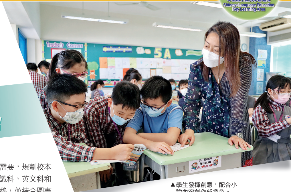
▲學生發揮創意，配合小說內容創作新角色。

觀課所見，課堂均配合常識科的課題和學習內容，運用創設情境、問答遊戲、比較閱讀、小組討論及匯報等學與教策略，引導學生學習。課堂學習目標清晰，規劃完整，組織嚴密，環環相扣，又能體現跨學科閱讀的優勢。學生學習能力頗高，預習認真，反應積極正面，投入活動，展示出良好的學習態度。教師善於架設鷹架，運用多元化學與教策略，逐步引導學生學習及完成任務。