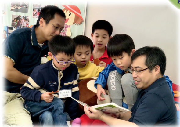
▲「寶湖親子讀書會」的夜宿圖書館閱讀活動