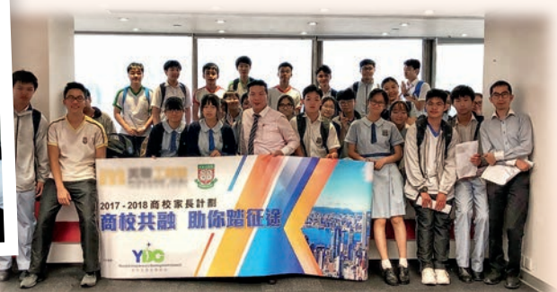
▲學生參加商校家長計劃，了解商業機構的運作。

見到學生以自己為榜樣，是教學生涯的莫大欣慰。兩位教師見證一位應考首屆香港中學文憑考試的學生，經過不斷的努力，成為經濟科教師，那份滿足感實在難以言喻。該學生受兩位老師啟蒙，對經濟科產生濃厚興趣，現於中學任教經濟科，有時還跟兩位恩師一起參加研討會，互相交流。