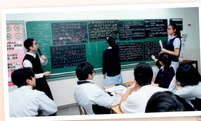
▲崔老師即場回應學生於小黑板上所寫的討論結果，幫助學生深化所學。

兩位老師付出的努力沒有白費，教案推出後，學生的學習表現明顯有所轉變，令老師感到十分欣喜。學生只需在上課前認真預習及做網上小測，無須再做功課。兩位老師在課堂上與學生討論小測的答案，以及鼓勵他們分享從預習掌握的基礎知識，繼而作高層次討論。學生交流多了，亦加深對知識的了解。