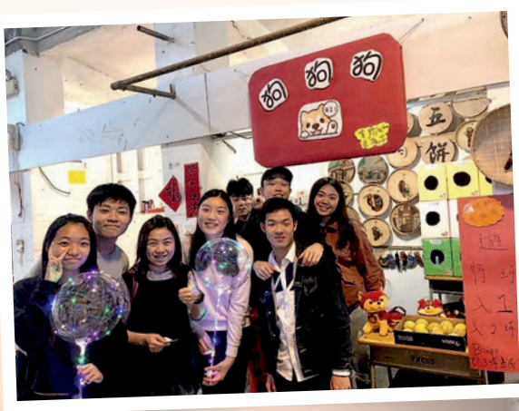
▲學生參與年宵活動，實踐課堂所學。

我們把經濟科課程每個必修單元和選修單元按不同重點分拆成不同部分，再為每部分製作學習短片及設計網上小測。每節課之前，要求學生在家中預習，按照自己的需要和學習進度觀看短片和完成小測，藉以照顧學生的多樣性。我們透過學生網上小測的表現，預先了解學生的學習難點，然後在課堂內梳理，並設