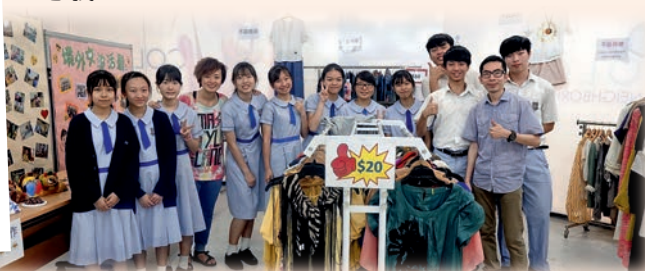
▲學生與特殊學校合作開辦義賣時裝店

我們希望學生有更多機會參與社區活動，實踐經濟理論，故此，我們經常舉辦不同的活動，例如參與年宵活動，幫助學生累積營商經驗，從實踐中了解不同消費者對相同產品有不同的需求彈性；又與特殊學校合作開辦義賣時裝店，在商場營運店舖，培育學生傷健共融精神；學生亦透過參與「商校家長計劃」，與不同行業人士交流，開拓視野，與世界接軌。學生能夠從「做」中學習，與人交流，學習更深刻及更有意義。