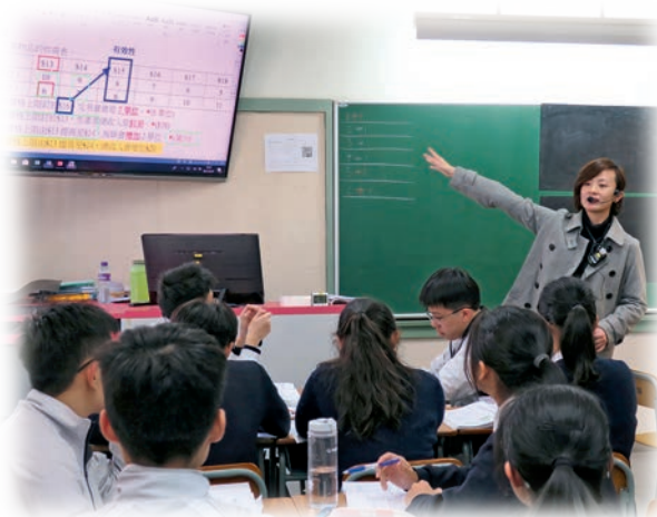
▲孫老師針對學習難點進行教學，發展學生的高階思維。