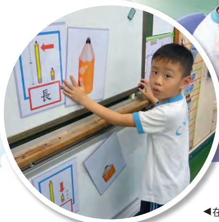
▲教師彈結他，與學生唱「歡迎歌」。