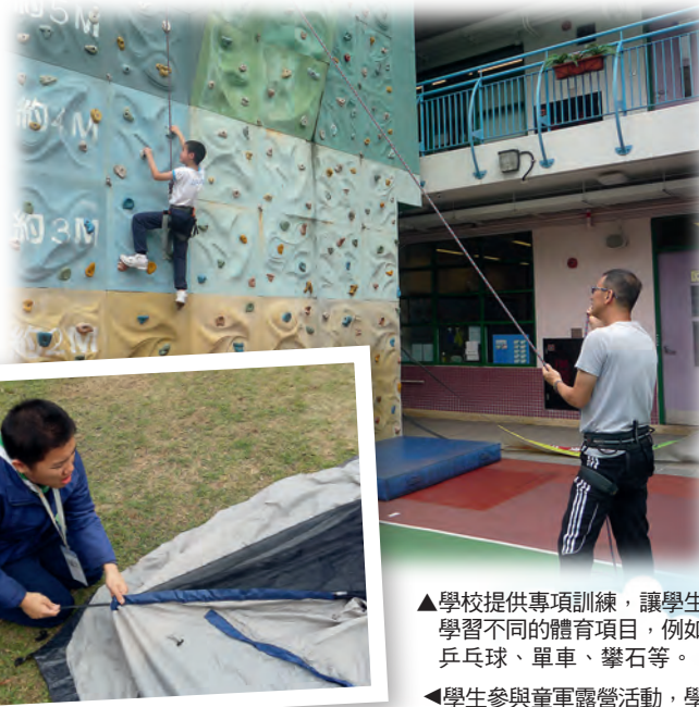
▲學校提供專項訓練，讓學生學習不同的體育項目，例如乒乓球、單車、攀石等。