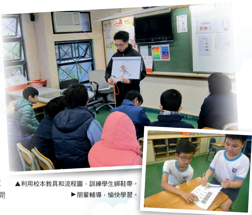
▲利用校本教具和流程圖，訓練學生綁鞋帶。