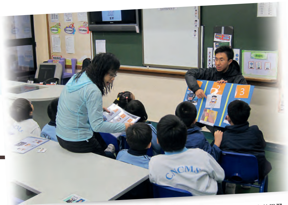
▲加強視覺提示，教師與教學助理合力幫助有自閉症的學生有效學習。

小組教師為學校資源輔導組的骨幹成員，致力發展多元化的教學策略和輔導模式，為特殊教育注入新的元素，並有效整合現有的資源，以實踐全校參與照顧學校過半數中度智障兼具自閉症的學生。小組教師共同規劃一個全面及具延續性的資源輔導計劃，設定施行和評估策略，並反覆實踐，具體而有效地落實各項計劃，全方位照顧有自閉症的學生，讓他們有效學習、提升社交能力、發展潛能，以促進他們的全人發展。