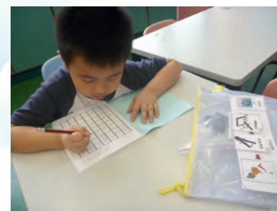
▲學生運用個人工作袋學習

我們在課堂注入音樂元素，為學生度身創作歌曲，提升他們的學習效能。有自閉症的學生接收言語指示的能力一般較弱，我們將指示放入樂曲中，幫助他們專注學習；教師與學生一唱一和，加強彼此間的互動。音樂的節奏及速度能調節學生的情緒，有助