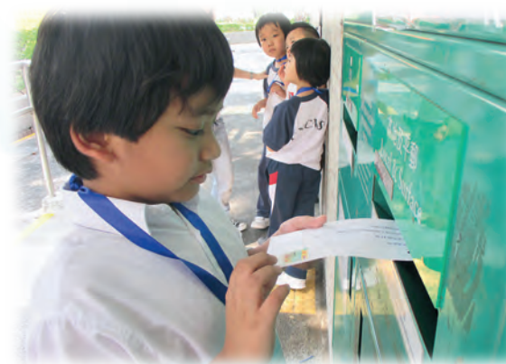
▲走出課室，學習使用社區設施。

每個學生都是獨立的個體，需要運用不同的教學和輔導模式，以配合他們的潛能和限制。我們引入九項教學策略，以期全方位地照顧學生的學習差異。