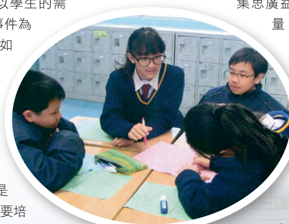
◀◀學生學習態度積極，師生、生生互動充盈。

為促進學與教效能，我們實行「集體備課」，各老師就教學內容進行討論及檢討，此舉有助同工之間集思廣益，發揮學習型教學團隊的力量。此外，我們亦配合學校推行的「結伴同行計劃」，支援新任教的老師，藉以將我們專業和認真的教學態度傳承下去。