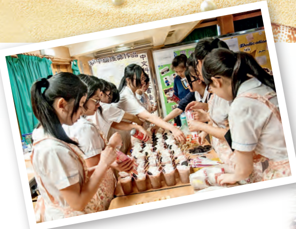
▶中四級的「挑戰自己」幫助學生發掘潛能，並培育合作及尊重等精神。

生藉着寫自傳能認識自己，發掘自己的能力與價值，為自己的未來訂下目標。細閱學生的自傳，有不少教人窩心的字句，許多學生在回顧自己的成長經歷時，都不忘感激父母、教師和同學的關懷和支持，反映學生心存感恩。」