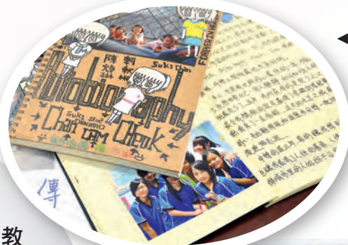
◀學生撰寫自傳，加深自我認識。