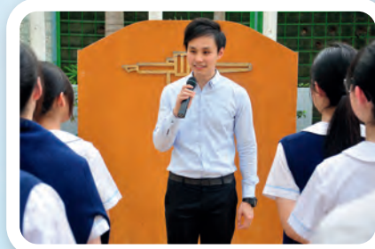
▼鼓勵學生擔任德育大使，發揮所長。