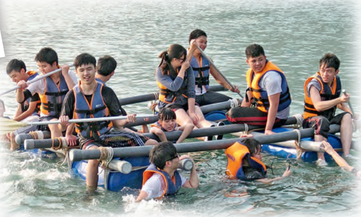
◀學生透過籌辦各類活動，建立關愛、承擔及責任感等價值觀。

學校每年的調查顯示，學生的自信心及自我能力評估，都較全港學生的平均數字為高，反映多年來校方給予學生機會發揮，讓他們在不知不覺間增強了自信心。