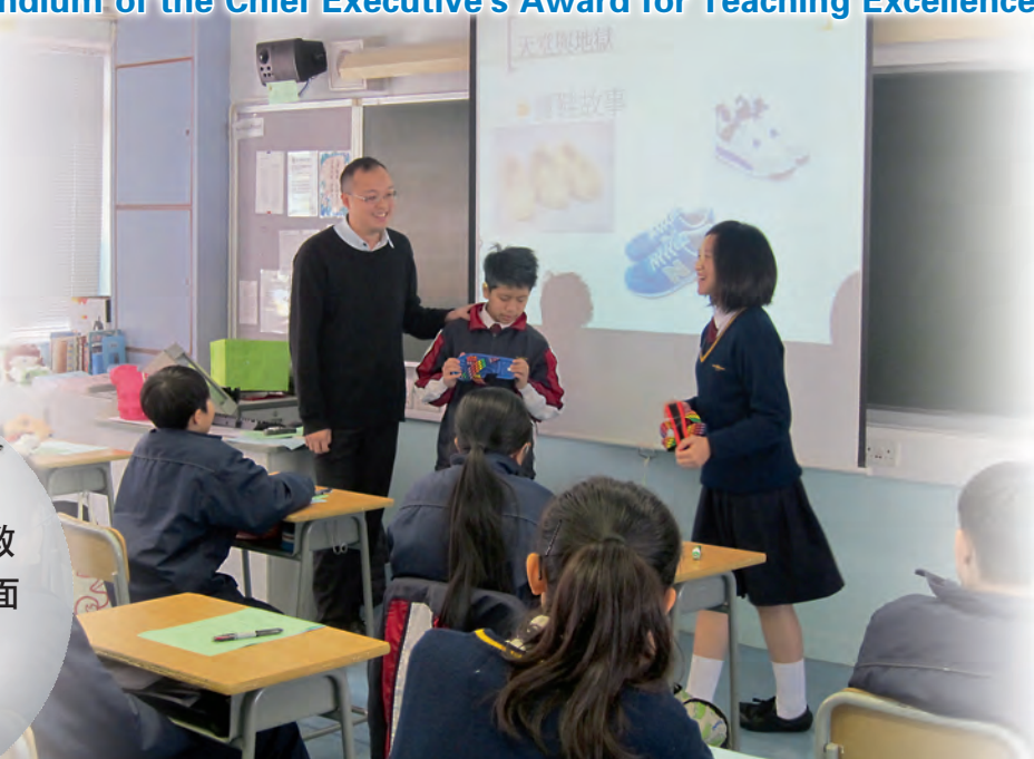
▲馮老師善用師生互動策略，幫助學生建立堅毅精神。

小組教師因應學生不同成長階段的需要，以「六自主題教育」為綱領，規劃一個全面、目標清晰、且具延續性的校本課程，將堅毅、尊重、責任感、國民身份認同、承擔精神、關愛、誠信等價值觀及態度融入課程，培育學生良好的品德，促進他們的全人發展。