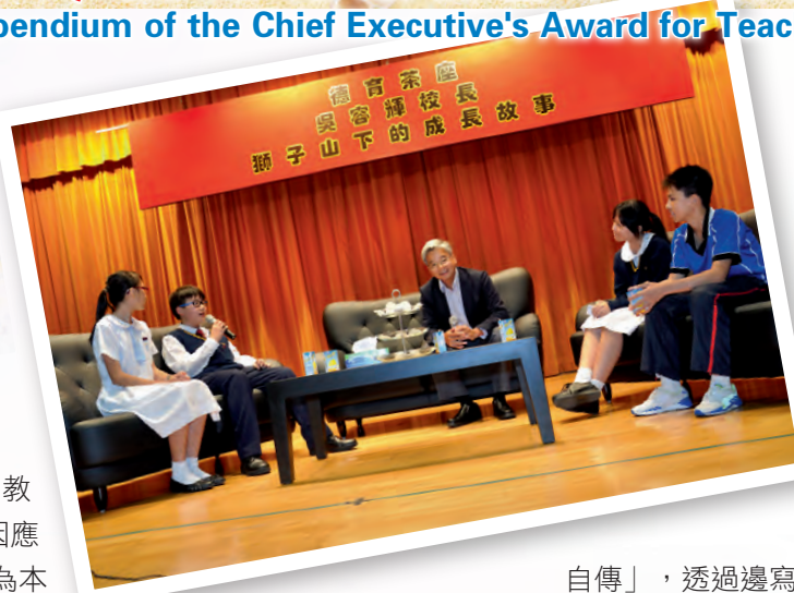
◀學生主持的德育茶座，邀請不同人士分享人生經歷。

人，便有助他們找出自我價值。因此，在中三「建立自尊」課程中，我們要求學生撰寫「我的自傳」，透過邊寫邊想的過程，了解過往零碎的人生片段，如何形成今天的自己。配以班主任、社會名人的人生經歷分享，以及到訪北京、上海等大城市，引發他們思考自己在國家及世界發展中擔任的角色。學生在完成自傳後，往往能深入地了解自己，肯定自我，更有目標的規劃自己的人生。