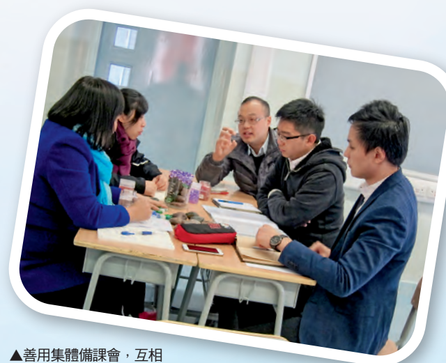
▲善用集體備課會，互相啟發，深化專業交流。

為了幫助學生有效地建立正面的人生觀，我們以What—「本堂學習的價值觀是什麼？」；以Why—「為什麼要培育這價值觀？」，以How—「如何實踐這價值觀？」三大原則設計每一課堂的學習經歷，好讓學生透過課堂的討論，清晰了解和反思所學價值觀的重要性，強化他們的獨立思考能力，以及確保學生能在生活中應用所學。