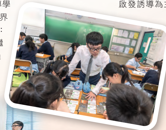
◀小組協作，照顧差異。

學生要學得到、學得好，須建立學習常規，課前認真預習，課上積極參與，才能達到高效能。教學以啟發誘導為主，課堂創設高參與情境，通過小組協作，同學互動，各抒己見，互相補足，照顧差異，做到廣議博思、群爭啟思、眾議補思，學生的思維能力得以充分發展。