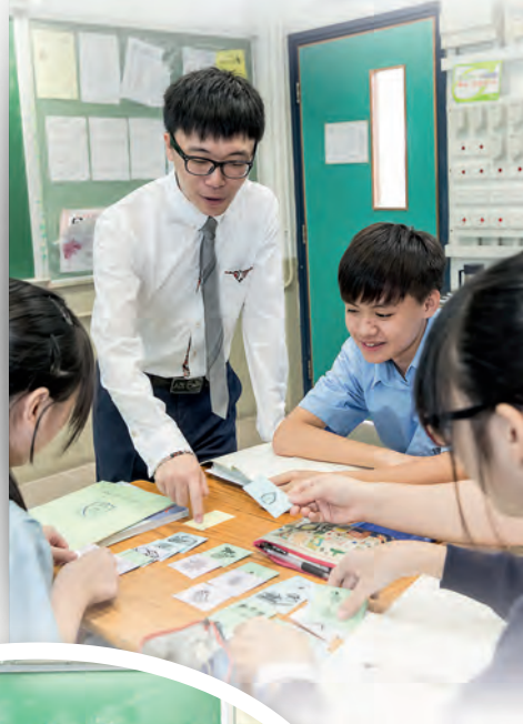
▲善用不同教材，使學習變得更有興味。

李老師指出傳統教學模式有可取之處，只是e世代生長於資訊發達的世界，不能單靠背誦課文，因此教學方法需要調整。他說：「課程改革後，我們更關注學習差異和啟發潛能，從前着重教師『教得好』，