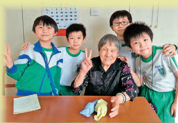
▲三年級學生探訪長者中心

校園內學生互相照顧；在校園外，他們也積極關懷別人。不過，小學一年級學生僅僅六歲，怎樣帶他