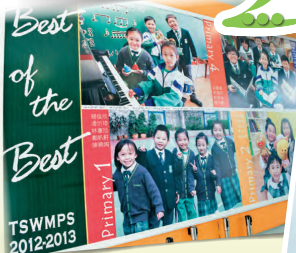
▲學校把優秀學生的相片貼在牆壁上

作為教育工作者，從不計較外界對天水圍這個社區的標籤；他們都有一個共同的信念，就是教好每一個學生。天水圍循道衛理小學五位教師同心做好培育工作，合力為學生建立一個溫暖的「家」，期望學生長大後，成為健康的良好公民，努力服務及貢獻社會。