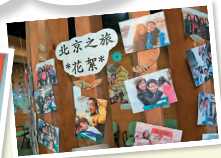
▲六年級「北京文化之旅」相片張貼在校園，讓全校師生分享旅程點滴。

往日學校「見家長」為的是處理投訴，現在跟家長見面，則是為了拉近兩個「家」之間的距離。在小小一開學之前，學校為家長安排新生輔導、課程之夜，班主任老師又會主動致電家長，通過「陽光電話」了解學生的日常表現，從而認識每一個新生，以及識別有特殊教育需要的學生。班主任跟小一家長全年會面的次數多達九次，因此家長跟班主任非常稔熟，仿如家庭的一份子。