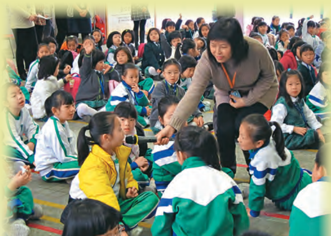
▲教師讓學生充分表達意見，啟發思考。

整體而言，小組教師從策劃至實踐等不同層面，以出色的規劃、多元化的策略，推動課程與資源的整合，落實學校「教訓輔合一」的培育學生理念，建構關愛文化，發揮團隊精神，推動「全校參與」。他們掌握學生的成長需要，能有效培養學生正面價值觀；學生能充分表達意見，啟發思考，發揮潛能。此外，教師的反思能力極強，經常檢討教學成效，持續優化學生培育工作，推動教師培訓，為學校建立學習型的團隊。他們積極促進家校合作，獲得家長高度的讚賞，誠為一支卓越的教師團隊。