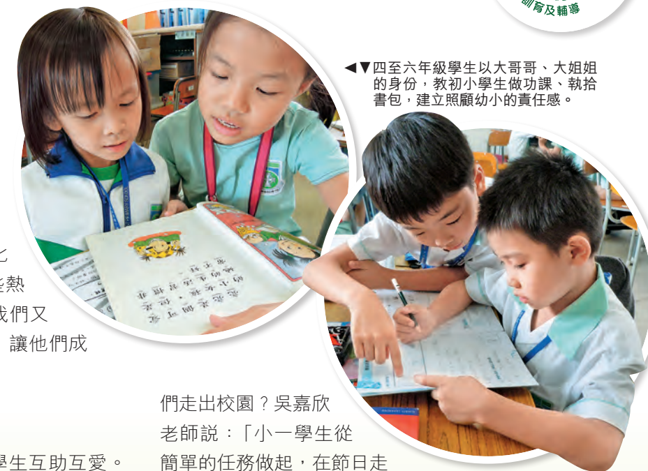
◀四至六年級學生以大哥、大姐的身份，教初小學生做功課、執拾書包，建立照顧幼小的責任感。