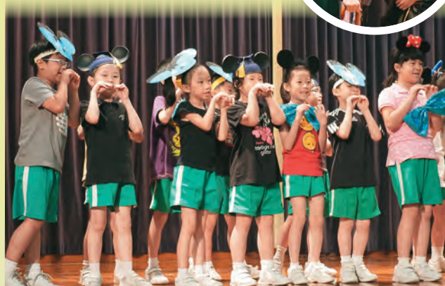
▲多元化學習活動，培養學生的全人發展。

我們以「本基督精神，發展全人教育；藉宣講福音，培育豐盛生命。」的辦學理念，配合「教訓輔三合一方案」，重新整合，推行具「天循」特色的訓輔工作，以培育全人為發展目標。