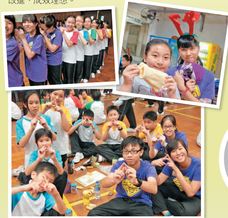
▲以尊重、包容和關愛建立的學習天地，讓學生茁壯成長。

活動出席率達九成以上的參加者，可免費到海洋公園遊樂，以作鼓勵。此外，每個成長導師（輔導組教師）會守望四至五個特工，提供適時指導及支援，以提升特工的輔導效能。多年來，這計劃不斷發展及改進，成效理想。