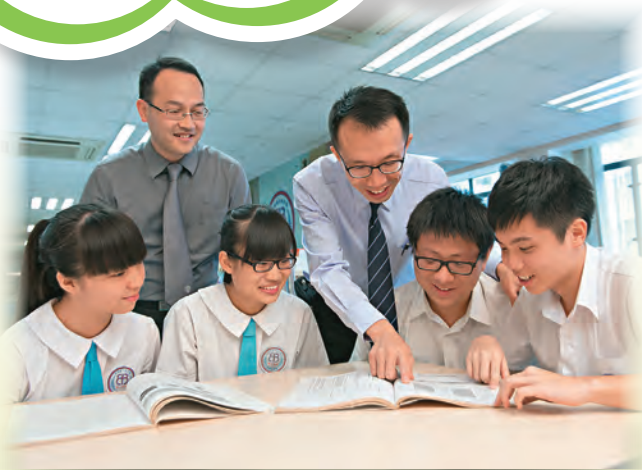
▲教師對學生循循善誘，加強學生的學習信心。

談起訓育輔導，浸信會永隆中學的兩位老師認為，應由教師層面開始，進行朋輩輔導，再慢慢將這概念推廣至學生和家長層面，全方位建立和諧關愛文化，為教學開闢良好的土壤。