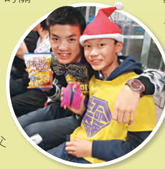
▲建立了深厚友誼的「特工」與「奇兵」交換禮物

另一次，魏老師要輔導一個沉迷打遊戲機的學生，卻發現原來學生的父親也一樣沉迷。於是他只可以從學生的母親入手，再嘗試從不同渠道輔導學生及其父親。