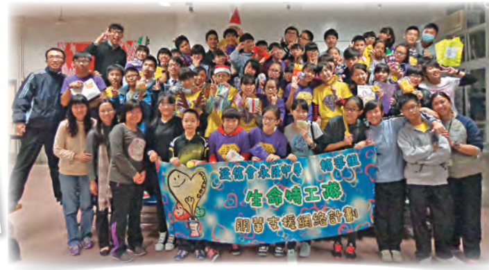
▲「生命特工隊——朋輩支援網絡計劃」

工」，更積極參與學生會事務和基督教團體活動。藍老師說：「各式各樣的服務活動讓他找到了自己的價值，他將來更想當一名社工，繼續服務別人。」