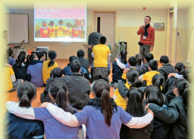
▲朋輩支援——「生命特工」為中一學生舉行試前打氣會，互相勉勵。

整體而言，兩位教師是組織型的領袖，具領導才能及感染力，對訓輔工作具專業知識及技巧。他們策劃的全方位「和諧關愛網絡」有效促進學生、教師、家長彼此支援，成功建立全校性參與的校園關愛文化。學生在和諧的校園氣氛下，表現和睦友愛，知禮守規。小組教師亦善用資源，照顧不同能力和需要的學生；他們樂於分享成功經驗，貢獻同儕，並積極推動家校合作，成功帶領學校教師成為一支優秀的教學團隊。