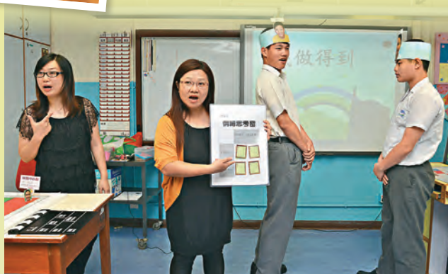
▲學生通過角色扮演，學習處理衝突事件。