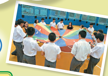
▲學生用「情緒傘」，學習表達情緒。

本校的訓輔工作強調正面鼓勵學生，肯定學生的良好行為，確認他們積極參與校內外活動的表現及成就，讓學生成長需要與校內整體教育結合，以「全人增值模式」推行具備發展性、預防性和補救性的智障學童訓輔計劃，學生在學習過程中發揮潛能，建立健康的自我形象，可以更自信而快樂地面對人生。