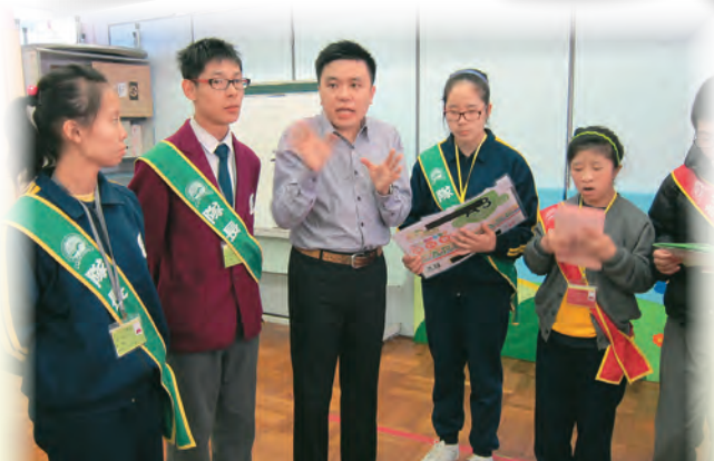
▲「糾察隊訓練」加強學生的紀律訓練

小組教師任教的學校為一所輕中度智障學校，以「學生為本」及「全人發展」為目標，培育學生良好行為及品德，為他們融入社會作準備。訓輔組有清晰的架構，分工明確、彼此互相配合，以全校參與模式，推動每位教師在學生訓輔工作中擔當重要角色，培育學生成長。