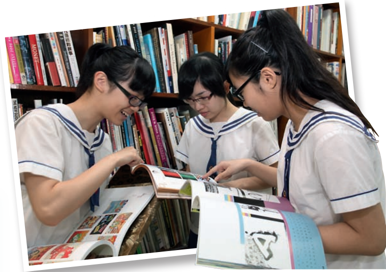
學生透過觀摩藝術家、設計師處理相似問題的手法，從中可得到啟發。

多看別人如何創作，有助提升解決問題的能力。吳老師舉例：「幾年前，學校打算以壁畫美化校園。最初打算邀請校外藝術家幫助，對方反映指牆壁上的裝飾線必須拆除才可。」可是，拆除裝飾線花費不少，後來校方決定由老師和學生負責，經過討論、研究，發現原來可以透過設計，將局限變成優勢。「我