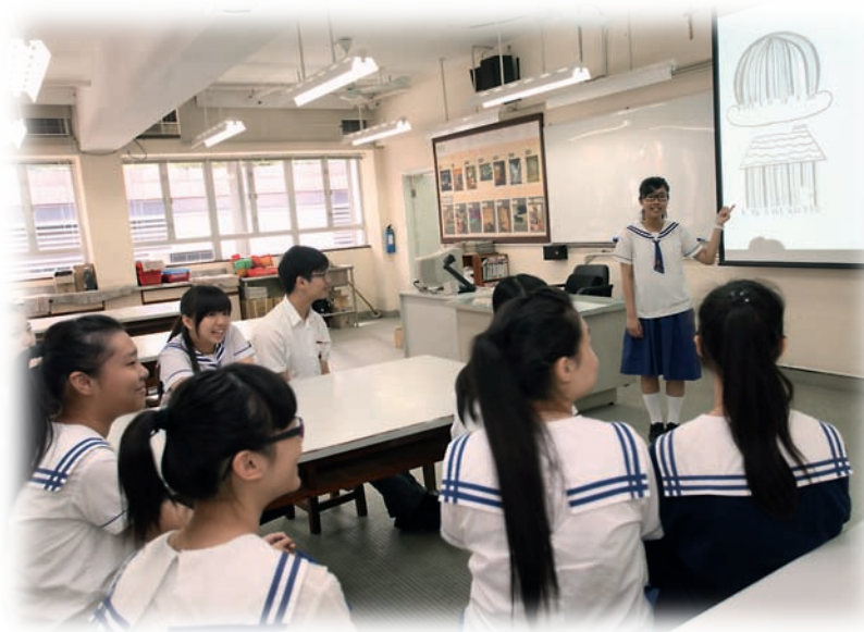
學生報告作品意念，訓練口才之餘，也可反思自身創作的優劣。

想像力可以打破事物的界限，吳老師更以身作則，以條碼為意念創作《嘉嘉的旅程》。「設計教學單元時，我在想：如果條碼有生命，可以說一個怎樣的故事？」該圖書獲得康樂及文化事務署主辦，2008年中文文學創作獎兒童圖畫故事組第二名，現在更成為他的教材，與學生分享創作意念和技巧。「不只是得獎作品，我也十分樂意跟學生分享落選之作。透過與比賽得獎作品比較、分析，指出自身的不足之處，以及人家的長處，讓學生從中學習。」