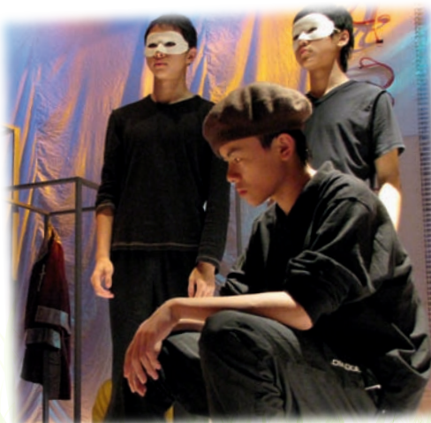
藝術能改變生命，有些學生會變得更有自信。留意學生在台上的神情及投入程度，便知道老師所言非虛。

劉老師多番強調歷史的重要性，另一個原因是歷史乃藝術的根。她解釋：「中國當代藝術家徐冰運用印刷術進行創作；蔡國強則使用火藥創作而聞名，他們都是運用中國四大發明。我經常告訴學生若要在藝術界佔一席位，便要認識歷史。」