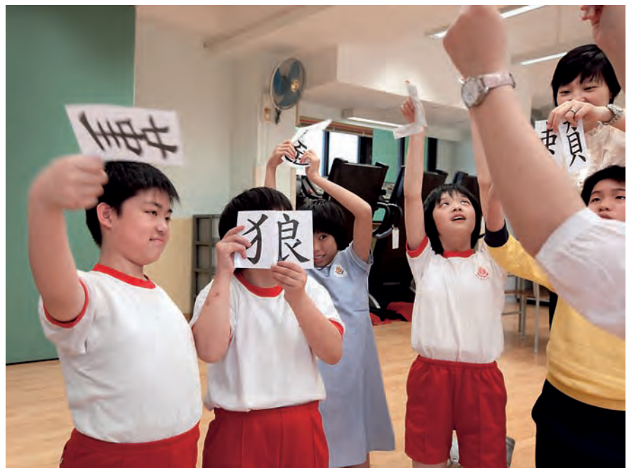
從拼字活動中，學生能夠掌握漢字的結構。

因應校本中國語文科課程的轉變，適切而針對性的教學策略能為學生的中文學習打下了堅實的基礎。中文能力的提升更有助學生過渡新高中階段的學習，觀察他們在通識教育科的表現，如閱讀資料、分析資料及綜合判斷等，更肯定了我們在這些年來的努力和成果。