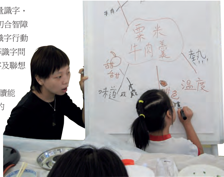
學生以「粟米牛肉羹」為主題，進行聯想字詞活動。

學生的識字能力獲得改善後，她們進一步提升學生的閱讀能力。劉老師表示：「初中中文科開始注重閱讀，但智障學生的提取、分析、歸納及匯報資料能力稍弱，亦較難掌握深層次思維，例如六何法中的『原因』及『為何』。」為針對學生的閱讀困難，她們與謝教授於06年研發「閱讀策略」，內容包括認識句子結構、故事框架、推測文意及文本比較等。