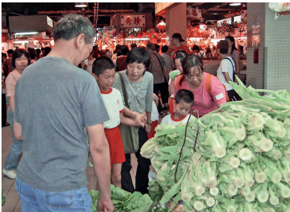
老師陪同學生參觀街市，從觀察中學習中文詞彙。

我們願意和竭力為培育每個學生的全人發展作出承擔，並認同救世軍教育的價值理念：「我們重視每個孩子都是上帝賜予的珍貴禮物：每一個受我們照顧的孩子，我們都會把他們的全面發展放在首位，包括身體、心智及靈性。」