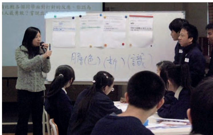
學生互評，老師從旁回饋及指正。

小組教師發揮專業精神，積極參與教學研究，努力經營改善教學策略，勇於嘗試，並樂於與同儕交流心得。小組教師在校內透過共同備課會議、共同發展以科為基地的有效教學策略，並透過定期的專業交流活動進行切磋、分享，使全校教師共享有效策略的心得和成果，促進學校成為一個追求卓越和專業的學習社群。