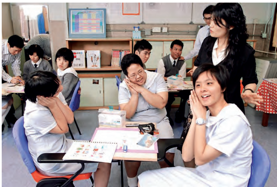
學生模仿貓的動作，增加聯想。