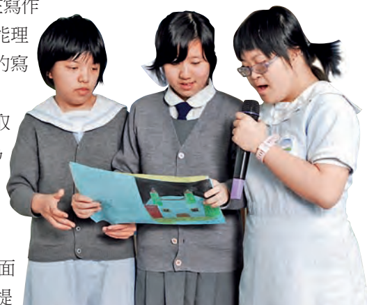
通過寫作可訓練說話能力

若要讓智障學生在合作學習上有所發揮，須面對一項重大課題，便是如何發掘他們的潛能，並提