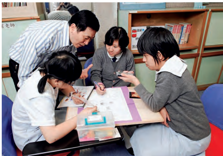
老師引導學生進行分組合作學習

小組教師樂意及積極將課程設計及教學實踐的經驗與同行分享，由2003年開始，學校獲選為「特殊學校暨資源中心」，持續為不同的主流學校及特殊學校提供培訓，為主流學校引入「以圖像組織提升閱讀能力」、「合作學習寫作教學」、「讀寫障礙教學策略」等項目；以及對其他學校教師及家長開設講座，效果顯著。為學校的持續發展，小組教師除了促進校內協作和分享文化之外，亦先後多次成功申請「優質教育基金」發展有關項目，為智障學生帶來無限刺激，啟發他們的創意思考，亦能積極實踐學校的願景和使命。