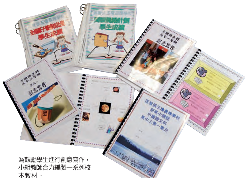
為鼓勵學生進行創意寫作，小組教師合力編製一系列校本教材。

小組教師透露，日後會繼續研究，期望將創意寫作延伸至閱讀、說話層面，幫助學生全面強化中國語文聽、說、讀、寫的能力。