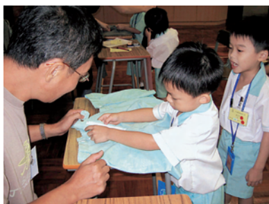
家長一起參與學習歷程，加深了解子女的學習情況。

此外，小組為配合校本課程，發展了一個多元化的評估模式，如專題研習、口語評量、活動記錄、師生評語及學習歷程檔案等，有系統地評核學生的學習表現。評估方法多元化，進展性評估與總結性評估並行，務求全面地反映學生的學習情況，並能給予學生改善學習的建議。