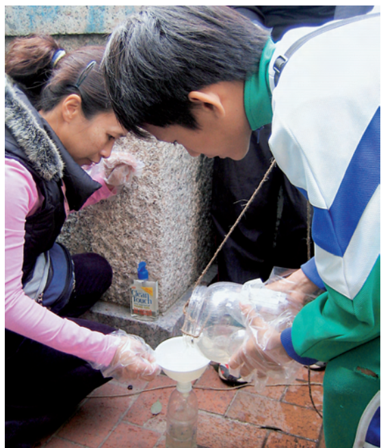
在天水圍社區收集水質樣本，進行化驗，以了解區內污染問題。

思考模式——數據收集、分析、結論及建議，並且能夠應用在其他科目上。另一方面，學生藉着親身經歷和體驗，進行分析及思考，並提出建議。梁迪偉老師解釋，這種學習方式，雖然要求教師事前需要多花人手及時間，但對學生的學習很有好處，故此值得推行。事實上，該校鼓勵更多家長義工參與學習活動，一方面了解子女的學習歷程，另一方面，能夠配合教師的教學進程。