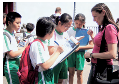
學生向外籍人士進行問卷調查，收集數據。