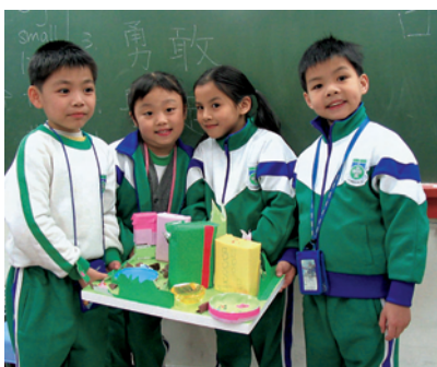
學生展示學習的成果

我們相信學生是未來的希望。因此從多元的課程中，幫助天水圍社區的學生發掘潛能，在不同的展示機會裏，體驗成功的滋味，幫助他們發現自己的價值，建立自尊和自信，讓這個社區變得更美好。