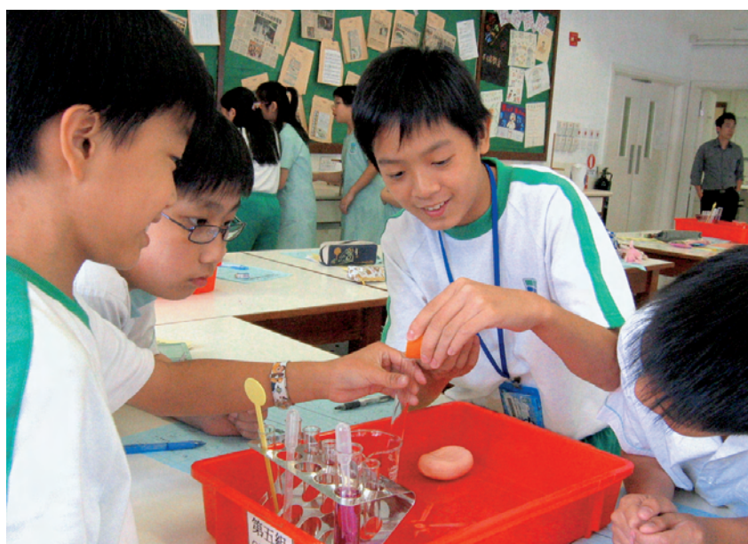
透過分組學習，培養學生團隊精神。

習歷程檔案能夠反映學生的學習情況，教師透過評語，提供具建設性意見，使學生能夠改善學習