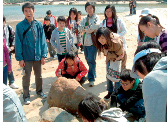
透過實地考察提升學生的學習動機