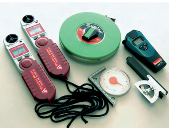
每次出外考察，都常備各種裝備。

而且有吸引力。」由於這些話題都是學生熟悉的新聞，又或者與他們的生活息息相關，因此，容易觸發他們的研究和討論的興趣。