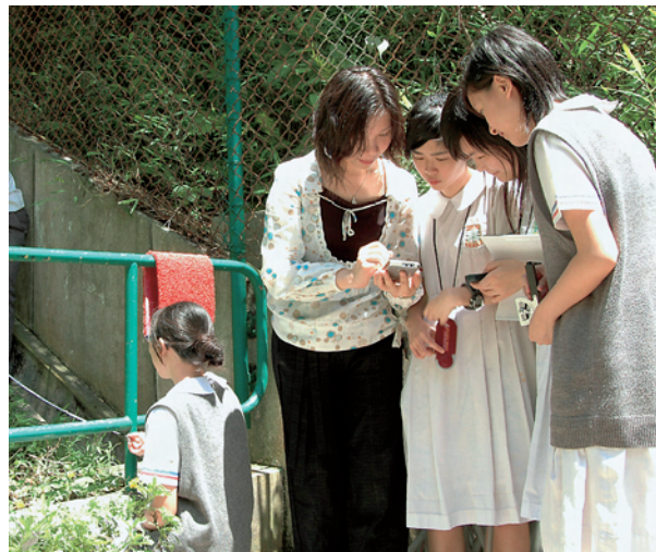
葉老師經常帶學生到戶外考察