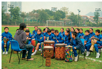
學校運動會中，學生表演鼓樂助興。