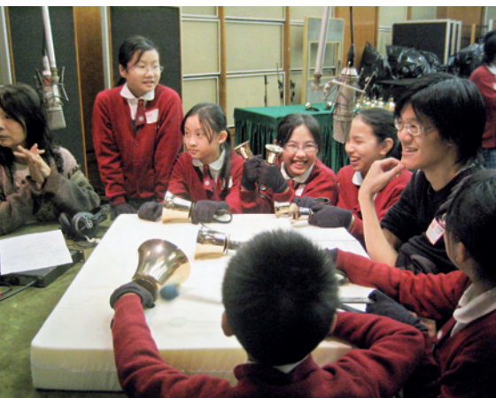
羅老師與學生接受香港電台訪問，並在大氣電波中即場演奏。

羅老師任教學校所在社區的文娛設施比較缺乏，支援學生學習音樂及藝術的資源亦較短缺，以致普遍學生在課餘參與音樂及藝術活動的機會偏低。他針對這個情況，積極成立各類樂團，提供學生在校內接受音樂培訓的機會。除優化原有的合唱隊外，三年來先後創立和教授手鈴隊、鐘鈴棒隊、手鈴板隊，並領導科組同工組織木笛合奏隊、敲擊樂隊和集體鼓樂等。在他悉心的教導下，學生的音樂能力不但得到提升，並且學會自律、自學、互相合作和主動分擔老師工作，發揮團隊精神，追求卓越。學校雖然十分支持音樂藝術教育，但資源分配總有限度，為謀求資源增值，他積極開拓家校、業界和社區聯絡網絡，尋找同路教師、友校及團體等的支援，藉着交流、觀摩和演出，擴大學生的見聞和經歷。此外，他成立了教師手鈴隊，積極籌辦校友手鈴隊；教師隊和學生校隊經常在校內和社區作音樂表演，為社區文娛生活注入動力和加添色彩。