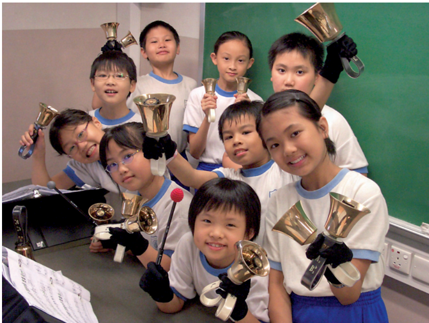
學生愉快地學習手鈴

教與學是互動的，有時為了讓學生更容易掌握所學的知識，他經常提醒自己要放下老師角色，與學生打成一片。「在教學生敲擊樂時，我會採用特別誇張的動作，甚至在地上打滾，來表示怎樣表達大聲，怎樣表達細聲。又例如教學生跳日本藝妓舞蹈時，學生怕難為情而不敢嘗試，於是我便身體力行，向學生示範，他們見老師也跳起舞來，便自然地大膽嘗試。」