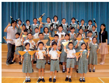
校內手鈴隊人強馬壯