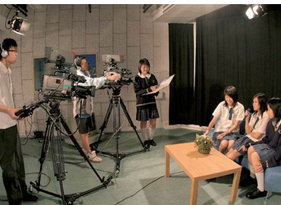
拍攝短片是群體藝術創作，需要學生分工合作，發揮團隊精神。

拍攝過程完成，便進入後期製作的時刻，解決問題能力及溝通能力在這裏便發揮着重要作用，