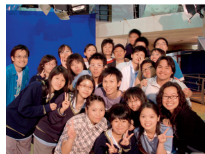
透過拍攝錄像短片，藍老師與學生建立一份深厚的情誼。