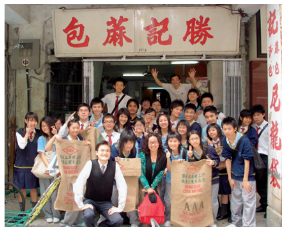
學生積極搜集資料，大部分拍攝的題材都與青少年自身或社會息息相關。

攝製工作亦告開始，由於短片拍攝是一個群體的創作，負責統籌工作的學生必須分配工作。在拍攝期間，學生在各司其職的同時，也需要不斷溝通，互相合作，大家才能向着同一目標進發。拍攝