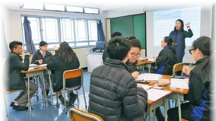
▲林老師透過異質分組，讓不同能力的學生均有參與和發揮的機會。

從觀課所見，小組教師透過異質分組，安排能力較佳的學生作組長，帶領能力稍遜的學生進行討論，每組負責不同的題目，其後再安排各組組員互調，令每位學生均有機會在另一小組內匯報，讓不