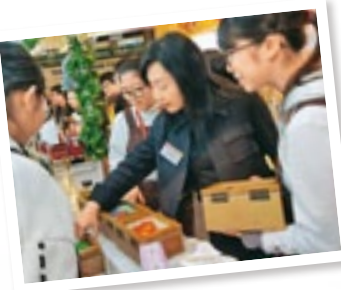
▲學生在「趁墟做老闆」活動中推銷自家製作的產品「衍紙燈盒」