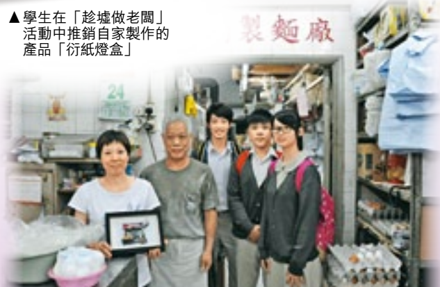
▲「本土商號·歲月拼貼」活動，學生致送Fotomo相架給商舖作紀念。