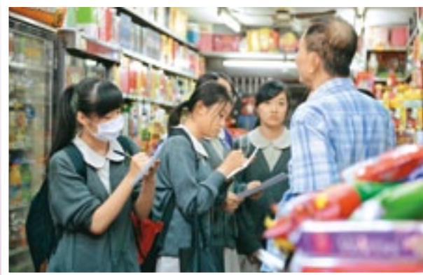
▲學生在「本土商號·歲月拼貼」活動中訪問區內商舖

一直以來，我們積極營造真實的學習環境，創業營銷計劃便是一個不可或缺的活動。由早年在教育學院及維園經營年宵攤位，及近年參與由青年成就舉辦的「JA 學生營商體驗計劃」及「學校起動」計劃一趁墟做老闆等活動，都讓學生更有系統地透過實踐來學習。我們會模擬真實企業運作，安排學生負責不同的崗位，由行政總裁、財務經理至銷售人員，為業務撰寫營商計劃書，自行設計和生產產品等，讓學生經歷營運公司的運作，把知識與技能從書本中實踐出來。參與營銷活動的學生表現均非常投入，往往通宵達旦地製造產品，過程雖然艱辛，然而收穫無價。