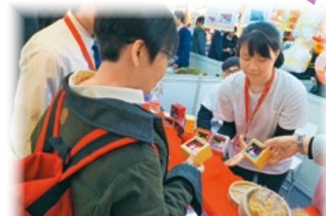
▲在「趁墟做老闆」活動中，學生努力推銷自家製作的產品「3D迷你世界」。

個人理財：課堂加入現金流工作坊、趣味人生理財設計和股壇達人模擬遊戲等趣味性情境體驗活動，讓學生更容易掌握各個獨立課題。