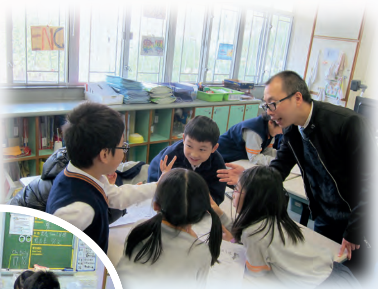
◀▲老師成為學生學習的促進者

梁老師表示，學生多來自小康之家，對於基層的生活認識不深，希望藉着社區服務，讓他們親身感受基層市民的生活，從而學會珍惜和感恩。兩位教師印象最難忘的一次，是安排一班小四學生接觸傷殘人士，學生主動地替他們推輪椅，沒想到招來「反效果」，令傷殘人士感到尷尬；原來他們雖然肢體傷殘，但仍希望自行操控輪椅，毋須別人照顧。梁老師笑言，「學生汲取教訓，明白幫助別人必須從受助者角度出發，考慮他人的感受。」