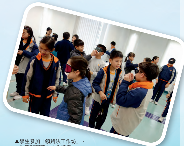
▲學生參加「領路法工作坊」，為服務視障人士作準備。

「社區服務課程」的發展初段，主要以提供多元化的學習機會為目標，各級學生分別以一個社會群體為服務對象，級別之間未有明顯的層階和連繫。隨着教師團隊對課程的掌握愈益紮實，我們意識到有需要發展一套價值觀培育及技能發展兼善的「螺旋式」學習經歷，以照顧學生在不同學習階段的需要，因此，我們在五年前開始對「社區服務課程」進行優化。首先，我們把每級的「社區服務課程」與該級校本常識科的單元學習緊密地聯繫起來。另外，我們又把籌劃社區服務所需要的知識和技能加以組織和整理，以