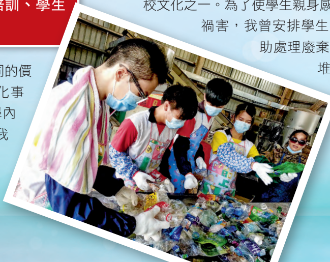
▲參與膠樽分類義工服務，身體力行，保護環境。

我一直積極將綠色概念滲融於各學習經歷之內，培育學生對環境保護的承擔，從生活小節上實踐環保，成為負責任的地球公民。例如：推動全校師生自備水樽盛水，減少購買樽裝飲品，排隊盛水已成為我校文化之一。為了使學生親身感受塑膠帶來的禍害，我曾安排學生擔任義工，協助處理廢棄塑膠，以減輕堆填區的負荷。