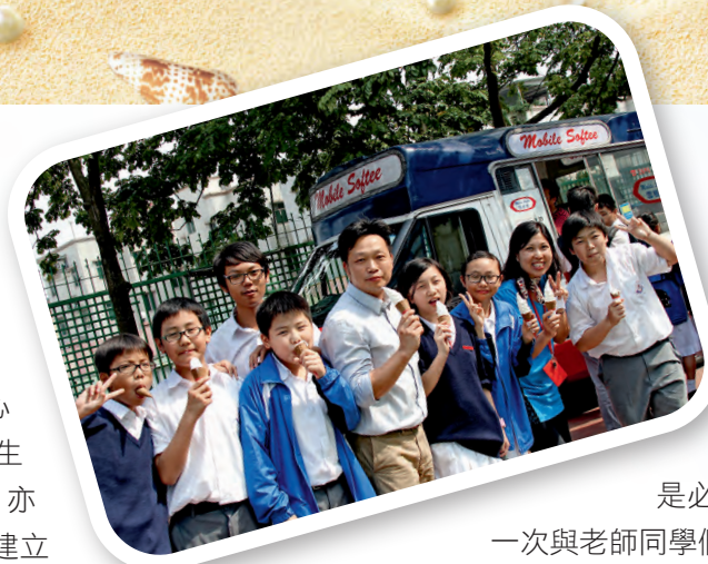
◀「我做到」班別大獎得主齊齊食雪糕

對我來說，交流團不是名勝景點之遊覽，而是生活的體驗與教育。還記得學生第一次坐飛機，緊緊地握著我的手；第一次在農村學校當小老師，他們明白