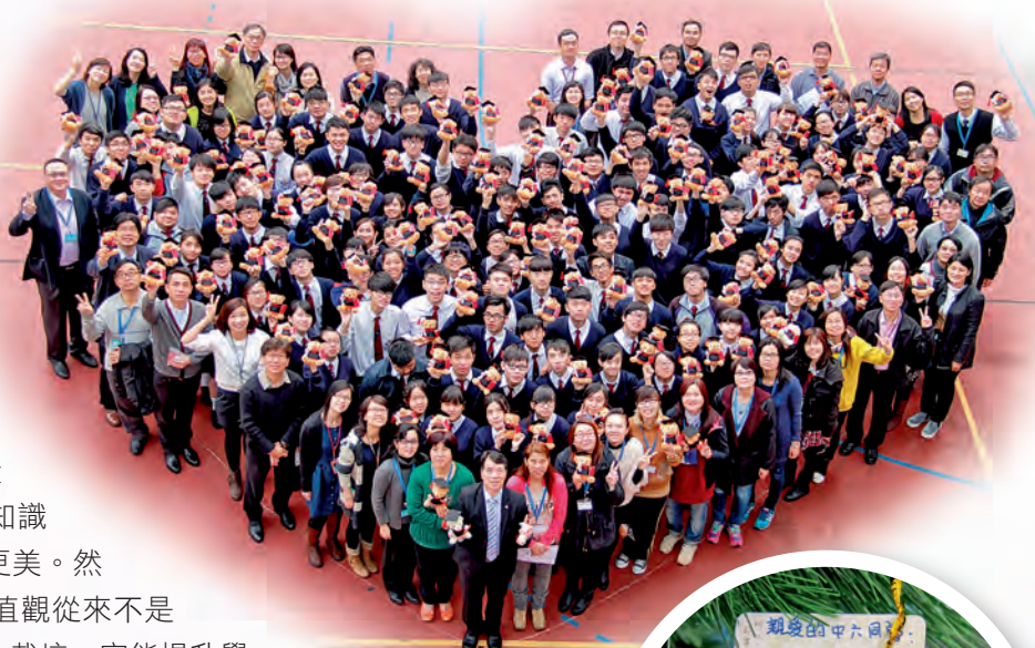
▲家長和學弟妹分別送上畢業熊和心意咭，為畢業生打氣，關愛之情洋溢校園。

我們採用螺旋式的課程設計，把不同的價值教育元素融入德育課程中，以生活化事件，配合時下青少年面對的問題作教學內容，培育學生均衡發展，建立整全的自我形象。例如：性教育的課題，我們會利用體驗式活動與同學探討戀愛、援交、