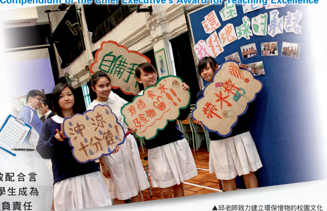
▲邱老師致力建立環保惜物的校園文化

邱老師能配合辦學團體的理念和學生成長的背景，規劃一個有系統、具延續性、全校參與的校本課程，將價值教育元素融入各級的德育課和全校性的活動，並訂定明確而可行的學習目標，培育學生正面價值觀及培養他們明辨是非的能力，使學生成為有識見及負責任的公民。