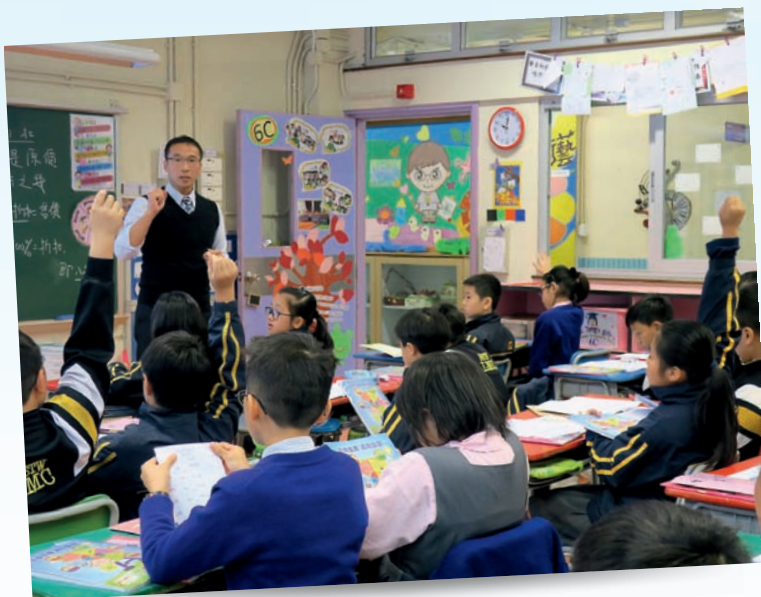
▲尹老師善用「幸福摩天輪」，引導學生運用「性格強項」。

正向教育理念，有效增強學生的自信心和強化他們的良好表現。他們積極協助同工專業成長，成功建立校園分享文化，並經常與業界分享正向教育的推展成果。小組教師加強家長教育，推動家校合作，製作「正向小貼士」，協助家長了解「性格強項」，以及相關的態度和行為，與家長共同培育學生正向思維。