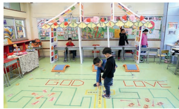
▲教師悉心設計不同類型的正向活動，讓學生從遊戲中培養正向思維。