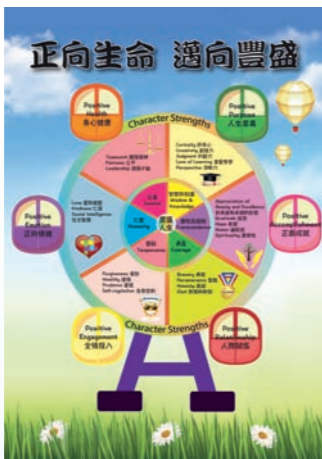
▲手冊印有「幸福摩天輪」，方便師生運用。

我們抱持育人先育己的信念，為全體教師安排「正向心理學」的專業培訓。教師從不認識到認識，從學習到體會，由疑惑到認同，過程絕不容易。我們喜見教師漸漸改變，過往教師常用「聰明」、「叻」等讚賞字句，現在漸多用了「你一定付出很多努力」。全校教師對學生循循善誘，適時鼓勵和讚賞學生，學生更願意投入學習，敢於接受挑戰。