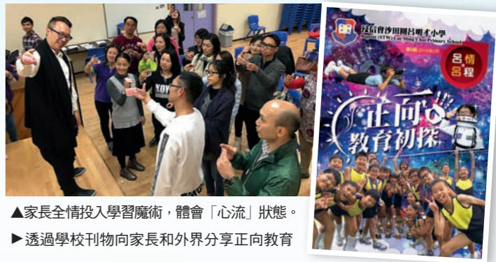
▲家長全情投入學習魔術，體會「心流」狀態。 ▶透過學校刊物向家長和外界分享正向教育

家長是學校重要的合作伙伴，因應正向教育的開展，我們除了開辦家長證書課程和正向家長小組外，更照顧未能抽空出席的家長，出版各類型的刊物，如《家書》、《呂情·呂程》、「正向小貼士」等，主動提供正向心理學資訊，讓家長與學校攜手同行。