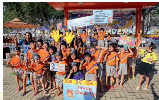
▲學生在水運會以自製打氣牌為同學打氣

正向教育是應用「正向心理學」的理念，認為人有24個「性格強項」，如「勇敢」、「真誠」、「堅毅」、「寬恕」、「仁慈」、「好奇心」等，概念抽象。怎樣教導學生掌握有關概念，再應用於日常生活是難題所在。小組教師為此花了不少心思，將24個「性格強項」塑造為24個「正向小子」，並邀請學生替他們度身設計造型。學生踴躍參與，他們設計的造型不但可愛，亦切合相對應的「性格強項」，創意和想像力令小組教師感到驚喜。由於出自學生手筆，他們對「正向小子」份外有親切感，更將「正向小子」視為朋友和學習伙伴，正向文化逐漸在校園內植根。