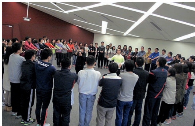
▲全體教師全情投入參與正向教育培訓

我們抱持育人先育己的信念，為全體教師安排「正向心理學」的專業培訓。教師從不認識到認識，從學習到體會，由疑惑到認同，過程絕不容易。我們喜見教師漸漸改變，過往教師常用「聰明」、「叻」等讚賞字句，現在漸多用了「你一定付出很多努力」。全校教師對學生循循善誘，適時鼓勵和讚賞學生，學生更願意投入學習，敢於接受挑戰。