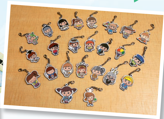
▲學校把24個造型可愛的「正向小子」，製成匙扣送給學生。

在浸信會沙田圍呂明才小學，有24個造型可愛，各有特色的「正向小子」，如充滿愛心的小天使、捍衛公平公正的法官、擁有豐富想像力的小畫家……他們不但深受學生的喜愛，更是學生的學習榜樣。「正向小子」其實並非真人，而是小組教師以「正向小子」代表24個「性格強項」。