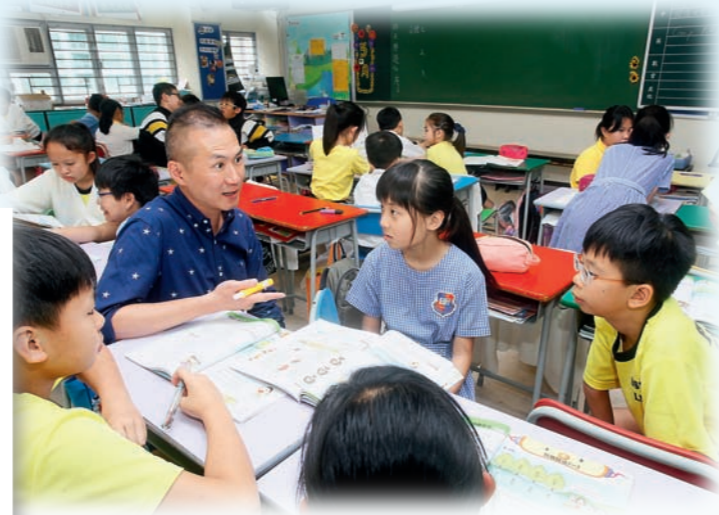
▲關老師在課堂上，參與學生的小組討論。 ◀教師運用班級經營策略，讓學生布置課室和設計壁報，發揮創意。