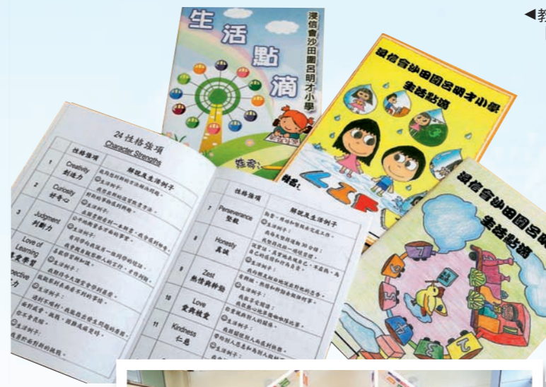
◀教師編訂「生活點滴」課業，加強學生認識及運用「性格強項」。