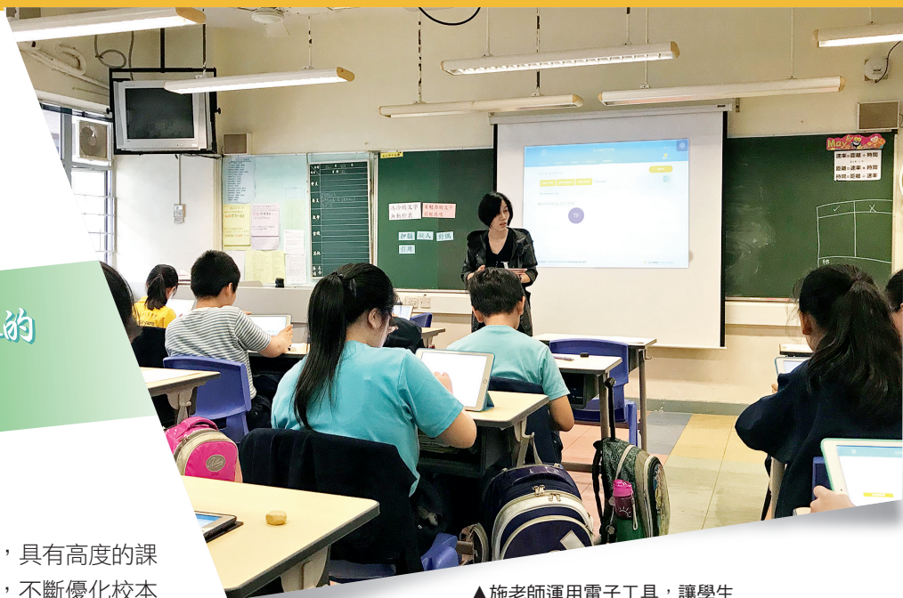
▲施老師運用電子工具，讓學生分享學習成果。

觀課所見，課堂均能體現語文教學的「厚度、跨度、溫度」。導學案設計緊扣學習要點，設有課前預習和課後延伸活動，配合課堂教學，體現教學的「跨度」。學生認真完成預習，能運用學習策略幫助自己掌握所學，上課時積極投入。教學流程具條理，學習目標清晰，組織嚴密。小組老師教學基本功扎實，具教學熱誠，課堂表現良好，每一位都能依循「讀中學、