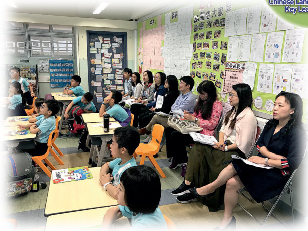
▲同儕觀課，互相學習。