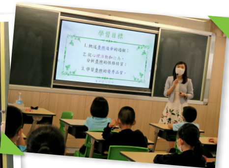
▲熊老師利用故事啟發學生思考 ▲劉老師展示跨科學習課堂