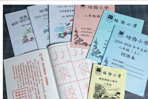
▲習作內容經過教師悉心設計