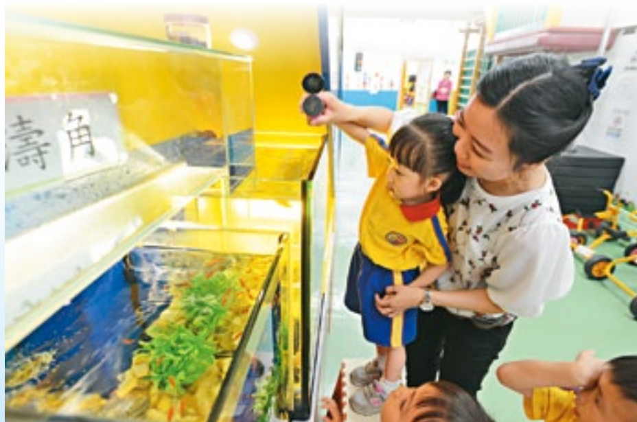
▲陳老師善用學校資源，教導幼兒愛惜生命。

「我們會因應幼兒的能力，採用大組、小組及個別學習等教學模式，目的是全面照顧每一個幼兒的需要。幼兒可以透過繪畫、唱歌來表達感情，同時亦可以發揮創意。成年人不應給幼兒太多框框，例如我曾經看到一個幼兒將太陽塗成藍色，原來他