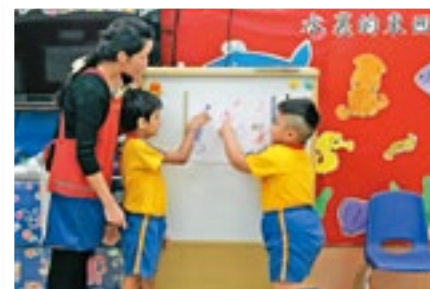
▲通過創作分享，增加幼兒表達的機會。

關顧幼兒的多樣性，首先要考慮每個幼兒的能力，再進行針對性的個別化輔導。例如教導較寡言的幼兒時，我會特別注意他們的非言語反應，以他們感興趣的話題進行對話和指導，讓他們知道我理解他們的想法。這方法相當奏效，幼兒