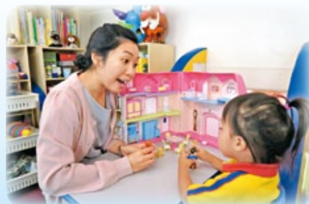
▲陳老師通過假想遊戲進行個別輔導，刺激寡言的幼兒參與互動。