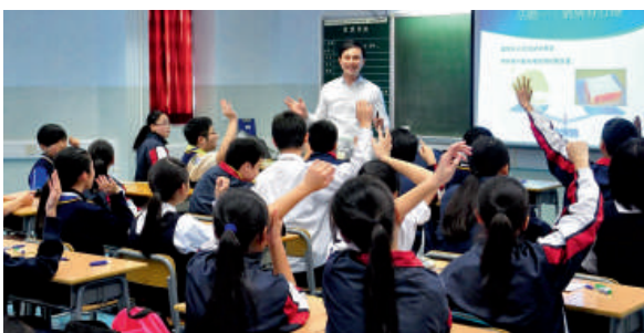
▲卓師會每年舉辦開放課堂活動，邀請得獎教師示範優秀的教學實踐。

行政長官卓越教學獎教師協會 Facebook專頁：行政長官卓越教學獎教師協會 電郵：ceateta@gmail.com