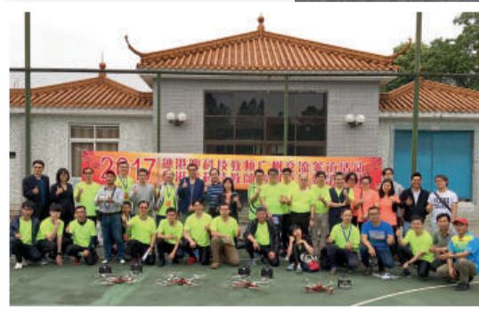
▲教師參與無人機培訓課程，學習科技知識。

除了培訓工作坊，卓師會亦舉辦境外交流活動，安排會員教師參加內地或海外考察，走訪不同國家和地區的學校，了解當地教育制度，借鑑成功的教