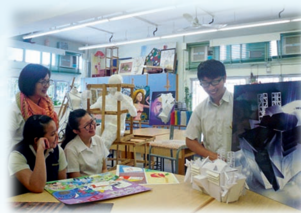
▲呂老師引導學生簡述創作意念，並作同儕互評。