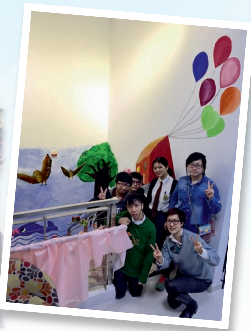
▲藝術天使義工合力創作壁畫，在社區推廣藝術文化。

作為資深的視覺藝術科教師，又擔任考評局多項職務，呂老師察覺近年香港文憑考試的考生選擇「設計」考卷的人數有下降的趨勢，很多考生傾向選擇「繪畫」考卷，她擔心部分學校的校本課程或會忽略培養學生的