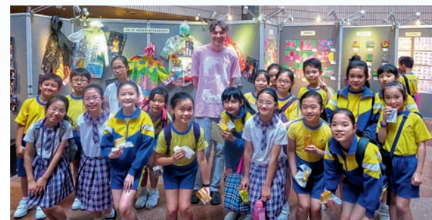
▲假香港文化中心舉行「香港是我家」學生視覺藝術作品展

知識、態度與技能的追求美的夢想家。十年前，我有一個心願，渴望於大型展覽場地展出學生的作品，建立學生的信心。2014年，我們視藝科教師有幸爭取到在香港文化中心舉行「香港是我家」的視覺藝術展，向公眾展示學生的作品，令全校學生感到興奮和鼓舞。在學校，視藝科每兩年都會在禮堂舉辦一次學生作品展。我為學生打造了一個校園藝術導賞展區，讓每個學生在學校留下親手製作的藝術品。就算平時不喜歡藝術的學生，也會努力完成一件作品，參與人生首個作品展，並在畢業時留在母校作為紀念。我就是這樣，每每利用學校的一幅牆或者一個角落展示學生的創作成果，努力經營，不斷為學校增添藝術氣氛。