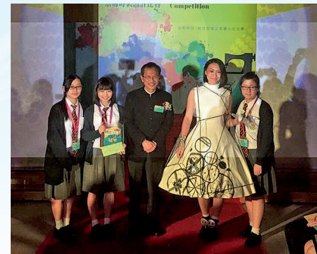
▲學生榮獲「禁毒時裝設計比賽」總冠軍，增強對學習的信心。

抗情緒病達兩年之久，當中有喜有憂，可幸該學生的病情漸漸好轉，令她感到非常欣慰。呂老師深信，藝術教育能令學生的生命更豐盛，故此，她每年都帶領「藝術天使」義工團，以藝術為區內長者及殘疾人士提供服務，回饋社會，同時幫助學生建立自信。