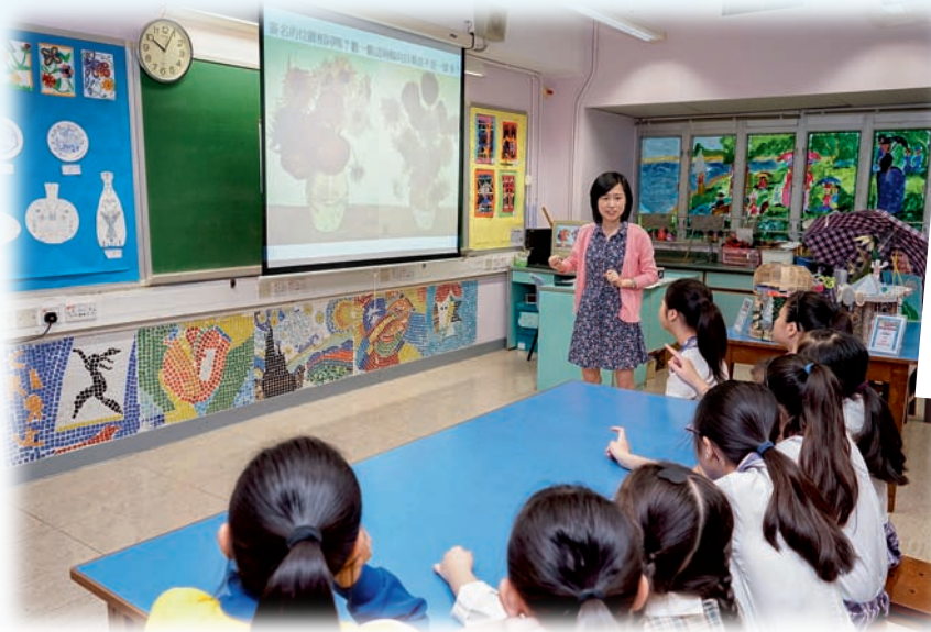
▲馮老師靈活糅合不同的藝術媒介，帶給學生獨特的體驗。