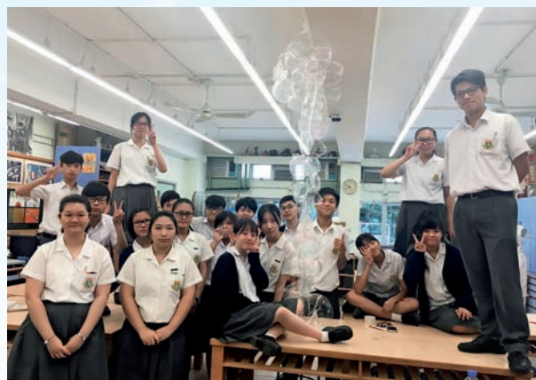
▲學生在課堂上創作汽球膠雕塑

創作的媒介，涉獵不同種類的藝術，並發掘自己的潛能，從而認真地選擇將來升學或就業的發展路向。