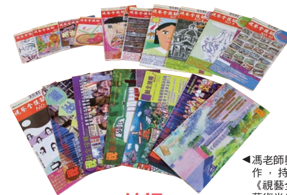
◀馮老師與同事合作，持續出版《視藝全接觸》藝術半年刊。

在教學以外，我亦醉心創作。自2013年成為畫會的成員以來，不斷鞭策自己參展和參賽，並把自己創作的經驗應用在指導學生創作的過程中，誘發學生對藝術的熱情。我與同事合作，為學校出版了19期的《視藝全接觸》藝術半年刊，增加學生欣賞同學作品的機會，同時又可以參閱有趣視藝小百科及潮流創意小品，並且把學校視藝資訊帶到家中和社區之內。學生無不熱切期待自己的作品刊登在《視藝全接觸》呢！