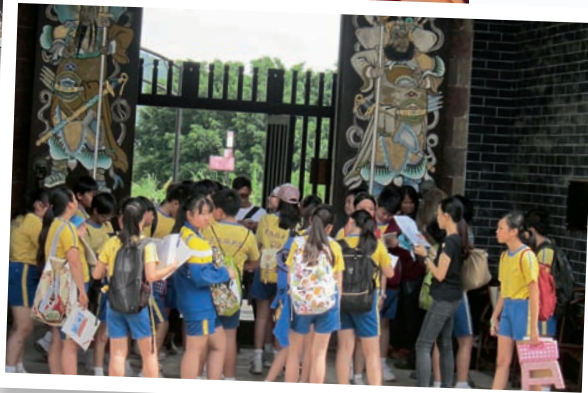
▲馮老師帶領學生進行定點導賞活動，在龍躍頭介紹香港早期的傳統建築特色。

近年設計的社區導向課程，讓學生了解藝術在社會、文化和歷史中所扮演的角色，例如六年級「粉嶺區的人地事」單元，由教師作定點導賞，帶領全級學生參觀中國抬樑式和穿斗式建築，深入認識中國古代建築的結構，並進行寫生活動，是很受學生歡迎的「走出課室」的學習活動。