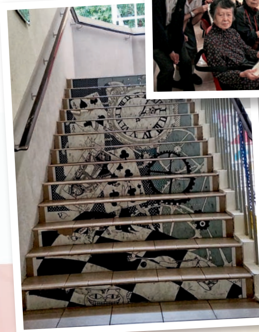
▼學生參與各種藝術創作，營造校園藝術氛圍。