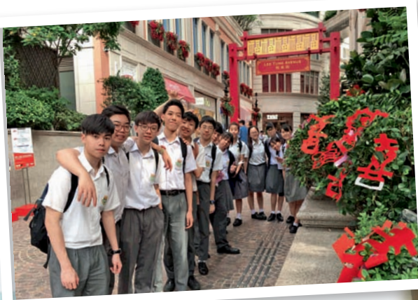
▲學生參與「灣仔薈匯」裝置創作

每個學生都有其獨特的個性與思維，會對時代和社會作出不同的回應，因此我每年都選用活潑、適切、具彈性的教材，以特定的專題去配合社區資源，使課堂內外的學習互相配合，包括出外參觀、與藝術家對話、專題工作坊等，教導學生從不同的角度觀察事物，開啟他們認識自我和探索內心世界的窗戶，並讓學生懂得以視覺語言表達個人的所見所想，反映社會的現實，甚至以藝術創作和設計推動社會的改變。我認為校本課程應該與時並進，應用最新的資訊科技，讓他們選擇適合個人