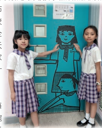
▲學生運用膠紙的藝術創作來佈置視藝室

我一直致力規劃視藝科的校本課程發展，並堅守四項原則：一、強調課程的結構。我根據課程指引，有系統地整合課程內容，以達到培養創意及想像力、發展技能與過程、培養評賞能力和認識藝術情境四個學習目標。二、重視藝術創作與生活的關係，把藝術生活化，生活藝術化。每年我都採用不同的日用物料作主題，舉辦親子設計及製作比賽，利用有限資源發揮參加者無限的創意，如「夢想飛行」白布鞋、「一疋布說故事」校服布料、「『帽』動全城」魔術帽、「雨天『家』年華」雨衣、「家有愛，碗滿載」木碗設計及製作比賽等。試想想，一雙普通不過的白布鞋，一頂平凡不過的帽子，每天都接觸到的校服、飯碗等，學生在這些日常生活用品上加添色彩及創意，