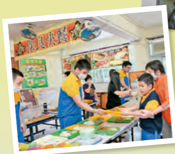
▲讓學生擔任「保良快餐」的收銀員、派餐員及水吧工作員，汲取職場環境相關經驗。