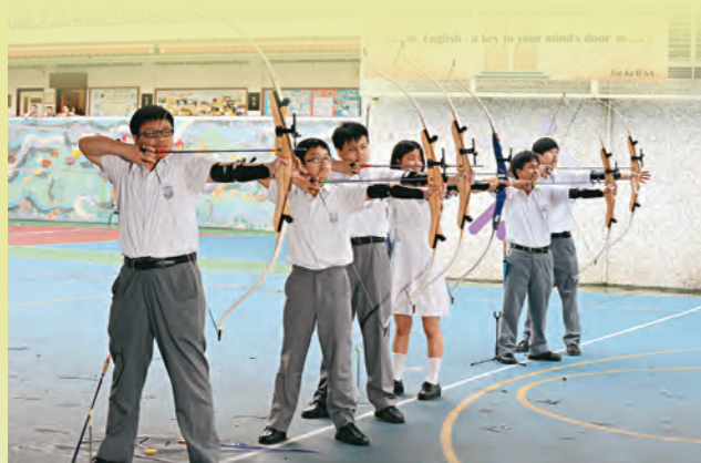
▲學校舉辦多元化的課外活動，發掘學生不同潛能。

一副慈父模樣的區老師原來曾經是威嚴十足，讓學生不敢親近的訓導主任。直至近年學校將訓輔合一，區老師的角色亦有很大轉變。「以前學生犯錯，