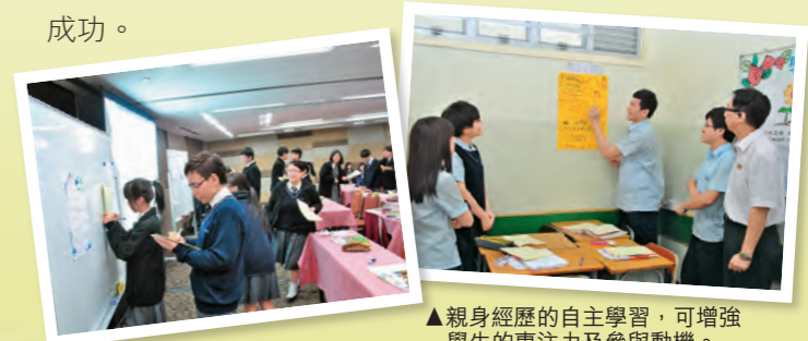
▲親身經歷的自主學習，可增強學生的專注力及參與動機。

學校每年舉辦多項以「閩僑Super Teens」為主題的活動，如中一級「有你同行」及「創明天」暑期活動、中五級「人生定向」、高年級「Super Teens 義工領袖訓練」等，提供不同機會，讓學生發揮自己