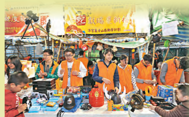
▲社會服務團學生於年宵舉行義賣活動，為山區助學計劃籌募經費。

與不同團體締結夥伴關係，並透過具體的協作項目引入校外支援。例如：去年在銅鑼灣獅子會的支持下，多位企業高層及專業人士到校為文憑試學生講解現今商界的現況和對員工的期望，並即場進行面試，豐富學生的經歷。此外，我們亦通過不同的活動和交