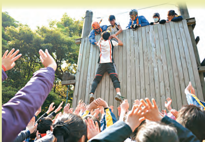
▲多元化的領袖培訓計劃，提升學生自信。

「採用德、訓、輔合一的方式，以品德教育教導學生學習『發現美』，進而了解他人背後的用心，實踐『以德化怨，以品立仁』的目標。設定校本訓輔計劃，營造和樂的校園氛圍，教導學生處理磨擦和衝突，同時增進朋輩間的互相了解和對自我的認識。」