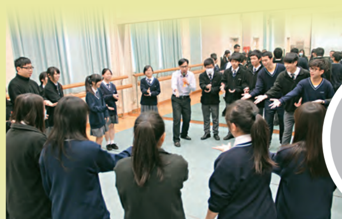
▲一個關愛的學習環境，讓學生能愉快學習。

作為廿一世紀的教師，不可再單向灌輸知識，要掌握「變與不變」，變的是在教學與訓輔工作上，能靈活調節，切合學生所需，亦要終身學習；不變的是本着對學生的關愛，營造出一個關愛的校園環境，讓每一個學生都能愉快學習，身心健康成長。