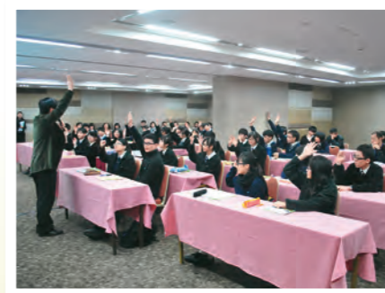
▲邀請學生參與教學示範，向外界分享有關成果。

活用「腦基礎學習」：透過了解學生腦部發展特性與學習的關係，運用不同的策略如確立清晰明確的訊號、指令和習慣，改變活動位置與模式、從挑戰中驗證成功、透過親身經歷自主學習等，營造最理想的學習環境，增強學生的專注力及參與動機，讓學生體驗成功，增加學生的自我形象。