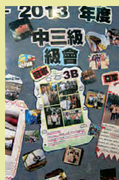
▲學生製作壁報，慶祝全班的努力成果。

「我們旨在幫助學生建立積極的人生觀及正確的價值觀，關注個人成長及發展，達至自我實現，為學校建立一個和諧而有秩序的文化。為此，本校的訓輔工作着重全校參與，落實於四個範疇，即常規紀律培訓、學生輔導、學生培育及升學就業輔導。」