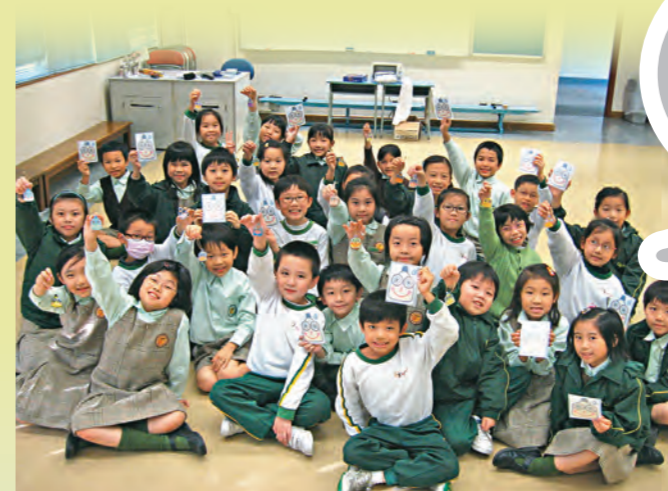
▲學生從多元化課程及實踐中體會「發現美」的真義。

百年樹人不求速效，我們期待孩子有了生命的方向和目標，為家庭、社會注入向上、向善的活水，如《論語》所云「老者安之，朋友信之，少者懷之」，為將來建構大同世界。