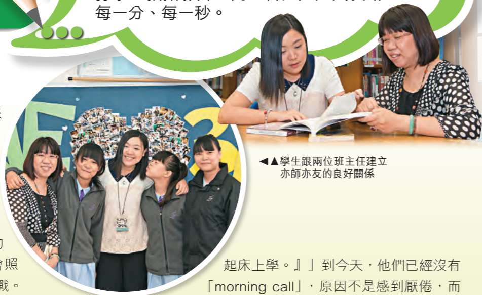
▲學生跟兩位班主任建立亦師亦友的良好關係

「一個也不放棄」說起來輕鬆，做起來著實不容易。天水圍循道衛理中學3B班兩位班主任，花了三年光陰，用愛築起一個安樂窩。這裏沒有「不關我事」，所有都是「我們的事」，就連兩位班主任提名「行政長官卓越教學獎」，學生也主動幫忙打字、拍攝影片，同心合力走過成長路上每一分、每一秒。