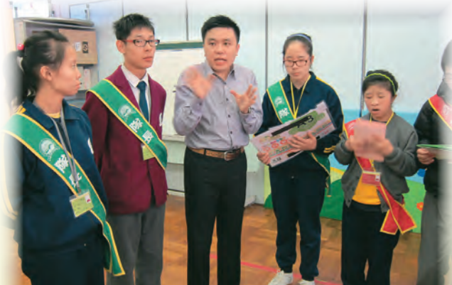
▲「糾察隊訓練」加強學生的紀律訓練

小組教師任教的學校為一所輕中度智障學校，以「學生為本」及「全人發展」為目標，培育學生良好行為及品德，為他們融入社會作準備。訓輔組有清晰的架構，分工明確、彼此互相配合，以全校參與模式，推動每位教師在學生訓輔工作中擔當重要角色，培育學生成長。