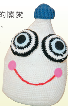
▲「美的眼藥水」引導學生發掘別人的內在美

「美的眼藥水」標誌着學校的關愛文化，它提醒學生要觀察、發現、欣賞及學習美。校園定期上演短劇，學生在劇中演繹平日遇到的社交問題，但每當主角滴一滴「美的眼藥水」，頓時發現不同的角度，不再為小事而爭執，取而代之的是正面思考，令自己和他人因發現美而感到快樂。