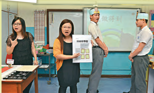
▲學生通過角色扮演，學習處理衝突事件。