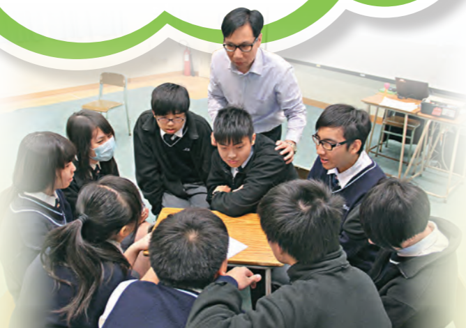
▲教師鼓勵學生表達意見

握學生的情緒，發掘學生的閃光點，令課堂「活起來」。他分享了實用「微技巧」：「學生不會舉手發問，老師可以說：『明白的同學請舉手！』，哪些學生需要輔助，便可一目了然。」