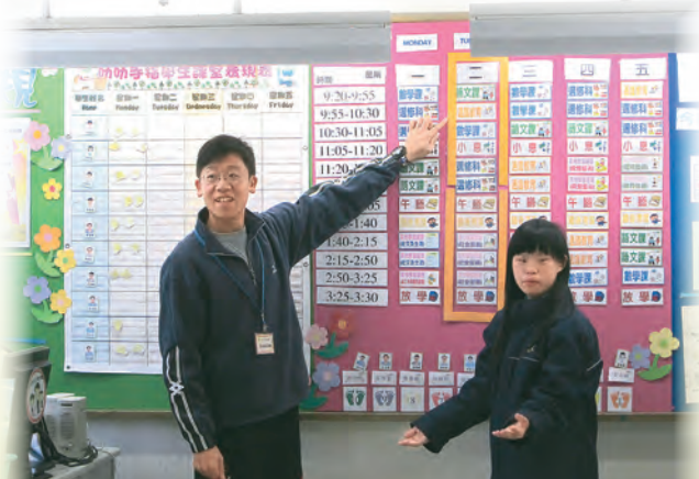
▲教師張貼學生上課日程圖表，訓練學生學習常規。

小組教師任教的學校是一所中度智障特殊學校，以學生能達至「自理」、「自治」、「自立」為目標，希望他們能融入和回饋社會。小組教師經驗豐富、分工清晰、互相支援與合作無間。以訓導組、輔導組、社工和教育心理學家組成跨專業的團隊，提升智障學生的能力及對家長作出支援。