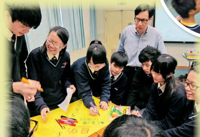
▲「閩僑 Super Teens」——學生積極參與解難活動

「教師有責任為學生提供一個幫助學習的安樂窩，我們深信良好的師生關係可改變一切。用愛和包容，激活班內整體的學習氣氛；學生的投入，使教學變得更有意義。當中關鍵在於教師能掌握全局，同時又放下權力，互相合作，善於變通，誘導學生對學習的追求，並提升其學習原動力。」