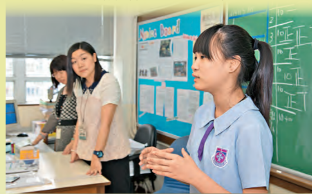
▲班主任「放手」由學生主持班務，提升自主感。

我們努力發掘學生的「亮點」，鼓勵學生參與校內外的課程和活動，例如圖書分享、詩歌比賽及義工服務等，使學生有機會發揮不同的潛能。教師要用正