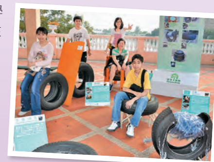
▲學生設計的作品備受肯定，獲不同企業機構邀請參與展覽。

為了提升學生的學習動機，其作品經評核後也會用作參加校外比賽。教師在過程中會擔當啟導者的角色，訓練學生的自學能力。獲獎學生除了體會成功的喜悅，也能在過程中訓練共通能力。例如：透過向傳媒介紹得獎作品，培養溝通和解難能力。