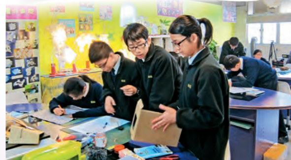
▲位於設計與科技室裏的「創意工作坊」

設計與科技科其中一個目標就是讓學生透過創製產品、建立系統和構思方法來改善日常生活；並衡量過程中對社會、經濟及環境造成的影響。課程注入創意與環保元素，有助學生設計符合社會需要的產品；配合環境和教材的互動作用，能觸動學生的情感，令他們投入學習；而生活化的愉快學習歷程，則有助啟發他們構思及創作新穎的設計品。