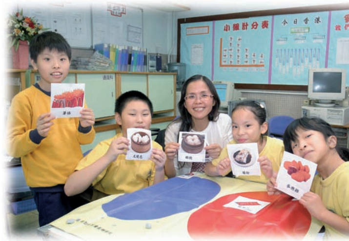
圖像訓練學生思考及分析能力

全世界都正在彩繪二十一世紀的未來，而教育成為一切增值的起點。然而，不管環境如何的變化，對教師而言，最重要的任務，還是要時時提升教學技巧，使教學專業化，更須以培養學生積極進取，主動學習的能力為目標。為了智障學童