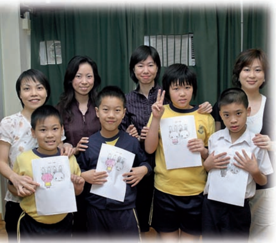
學生展示完成的習作，甚有成功感。

自閉症學童的獨特之處往往令人又愛又恨，他們的爽直有時會帶來尷尬場面，他們的固執有時會令人感到莫名其妙，歸根究底都是因着他們在溝通、社交，以至感知機能上有明顯的發展障礙所致。作為教育他們的老師，在使用不同的教學法時，一方面要配合他們的特性，一方面又要有效的協助他們融入社群中，這是近年來我們努力的方向。