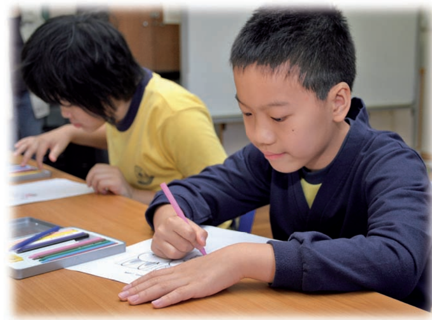
自閉症學生只要獲得適當的訓練，亦可投入社會。