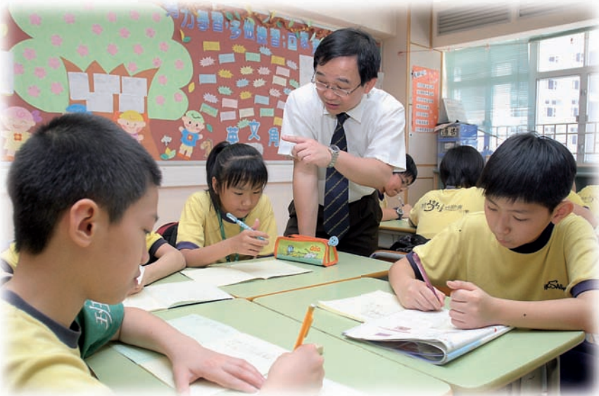
蘇老師採用「小步走」的教學策略，幫助學生掌握艱深的數學運算方法。