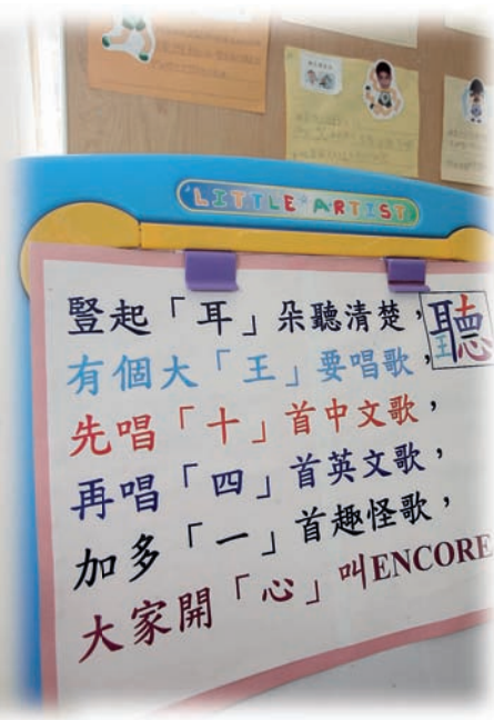
口訣歌歌詞既生活化又有趣

曾在國際學校任教的譚老師，善於以活動形式教學，個人創意無限，又瞭解學生的喜好，她在過去兩年間創作了30首口訣歌，當中所教的全是一些學