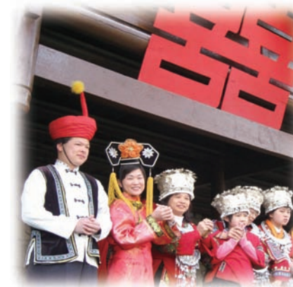
「伴我行」境外培訓，讓家長進一步掌握自閉症子女的特徵、教導方法及技巧。

立良好行為及提升自我管理能力，家長的合作非常重要。因此，老師定期與家長溝通，向家長講解自閉症兒童的特徵及處理不當行為的方法，讓家長一旦遇上孩子出現行為異常時也「有備而戰」；學校亦會每年舉辦「家長工作坊」和其他活動，與家長交流經驗；還特別安排學生參與如接待、佈置等工作，讓家長看到子女的表現，重燃對子女的希望。