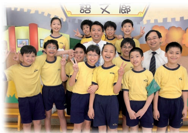
兩位老師與學生相處融洽，關係亦師亦友。

和指揮若定的神態所吸引，並報以熱烈的掌聲。這時，從他臉上流露的，是久久遺失了的喜悅和自信。在那次活動中，他為所屬的組別贏取了不少分