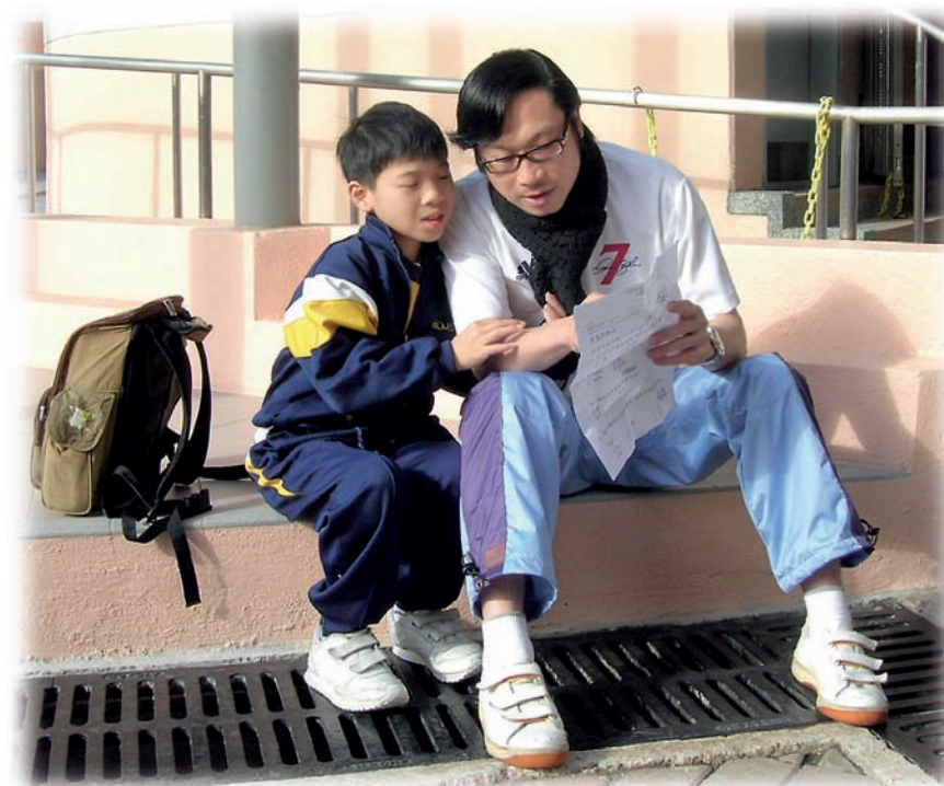
陳老師運用視覺策略，向學生預告突然改變的學習活動。

要面對社會上各式的挑戰，由找工作、到跟同事相處之道，以至面對挫折等，學生都要有足夠的心理準備及技巧來應付這些轉變。