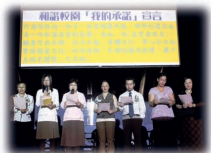
師生、家長及社區人士共同宣誓，承諾共同創建關愛校園。