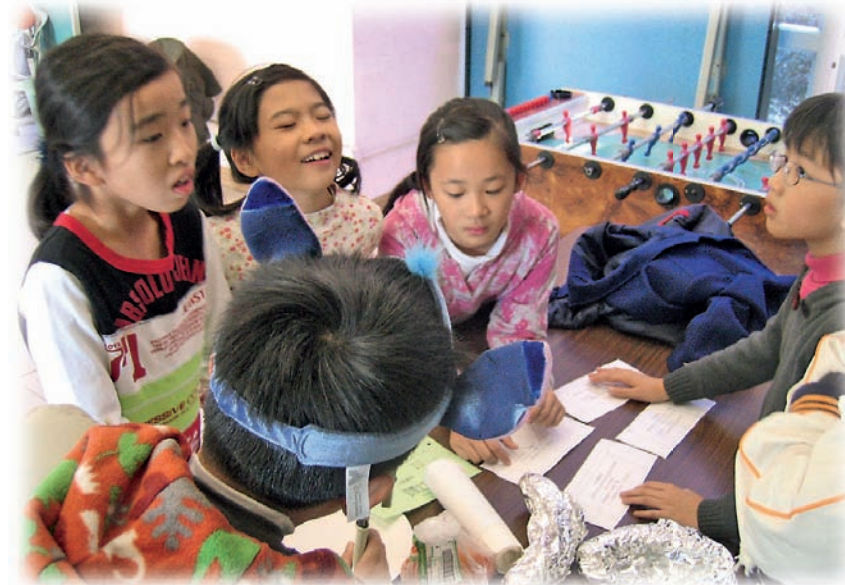
沒有刀子，只有蘋果；沒有夾子，只有合桃。該如何製作蘋果合桃沙拉？小領袖運用思考與協作，進行創意解難。

力，而高層次思維能力是當中的核心。她們希望透過培育學生高層次思維能力，讓學生懂得主動學習和具備解決問題的能力。在發展資優教育校本課程時，學校從抽離式資優培育課程作切入點，配合由前教育署的「群集學校資優計畫」及「種籽計畫（資優教育）」培育具領袖潛能的資優學生，並在學校發展校本甄選機制。整個課程以資優教育三個元素作為設計目標，培育小領袖與人協作的 ability、創造力、批判性思考能力，特別重視情意的培育。有關甄選機制由前教育署資優教育組同工協助建構。近年，她們把甄選機制發展為培育領袖細心觀察及自我反思的課程，讓富經驗的領袖生擔任面試觀察員，從觀察中學習，加強自我反思的能力。