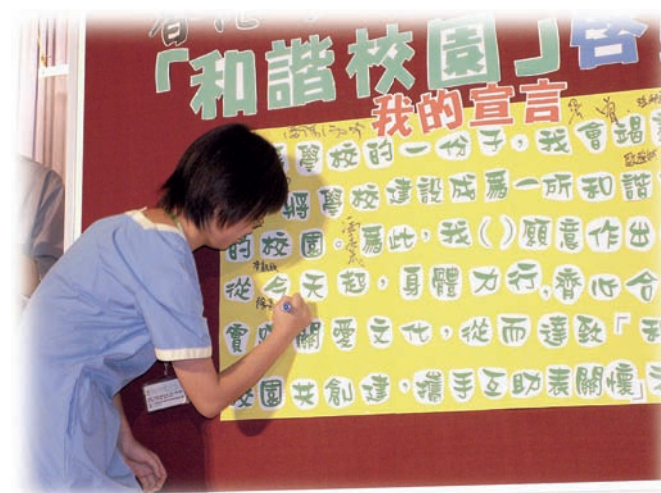
學生簽署學生宣言，以身體力行的方式，營造關愛校園。