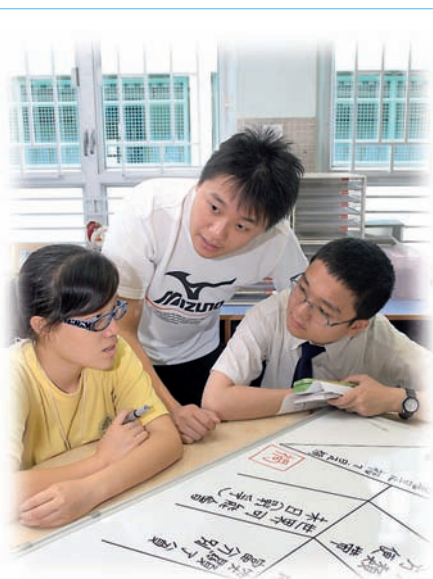
小組討論，讓學生從多角度思考。

以全校參與的模式，成功地實踐了「圖像組織」與「合作學習」的學與教策略，活化了學校課程，有效地提升智障學生的思維與協作能力。