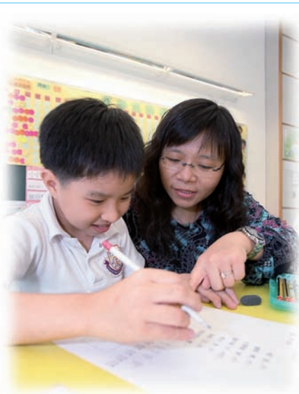
學生學習上遇到困難，譚老師會從旁悉心指導。