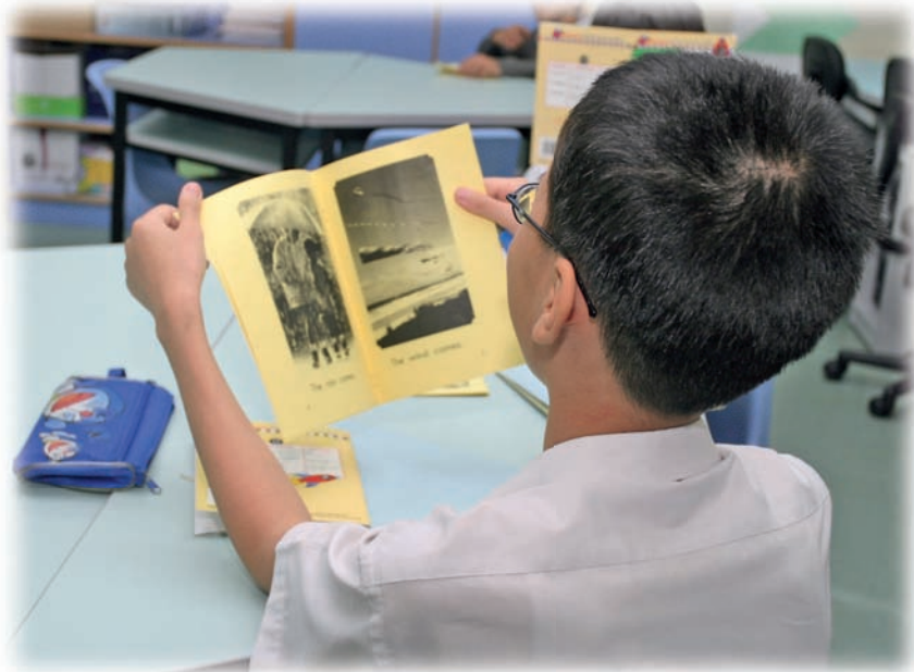
老師會與學生一起朗讀閱讀本（reader），使學生沉浸在豐富及有支援的英語環境中，慢慢吸收英語知識和技能。

走進課室時，一句清新悅耳的「早晨」，即時傳到耳際。然後，一把響亮而開朗的聲音直接的提出他的要求：「拍照可以拍我側面嗎？我側面較好看。」看著學生燦爛的笑容，聽到這句坦率的說話，可以想像，在「資源班」的學生正在開開心心的上課。