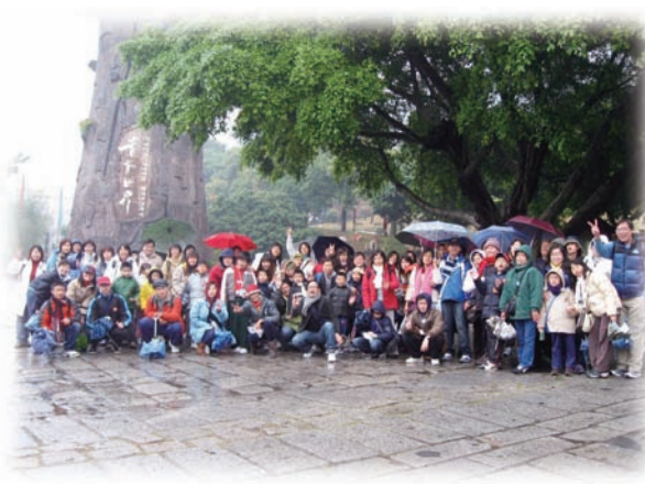
「伴我行」境外培訓為師生及家長安排愉快的境外遊，建立良好的伙伴關係。

註2：IEP突破計畫：為每名自閉症學童設計全人的學習及支援計畫。內容涵蓋八個範疇：學前及學習技能、思維能力、感知肌能、自理技能、溝通技巧、社交群處技巧、獨立生活技能、情緒及特殊行為。