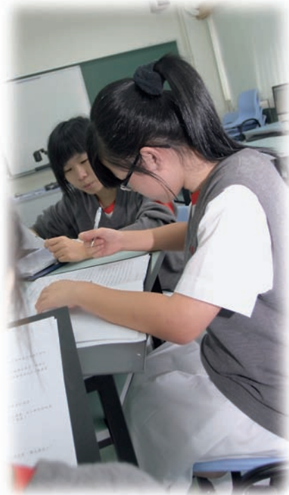
小組學習除增進知識，亦可學習與人相處的技巧。

我們深信，每位學生都有獨特而不同的學習需要。要成功推行融合教育，必須從學習環境及課程調適方面着手。我們根據 SEN 學生「個人教育概覽」的資料，為他們制訂中、英、數三科的「個別學習計畫」（IEP），擬定長期學習目標，再依照學生的個人進度，於每個評估期為他們訂定分段學習目標，使學生能循序漸進，並按照自己的能力學習。此外，家長可以透過每年舉行三次的「個別學習計畫會議」，瞭解