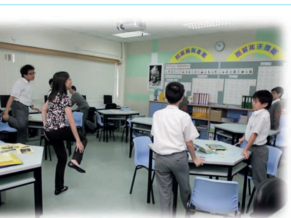
老師運用多元感官教學策略設計課堂活動（例如肌肉活動），以加深學生對所學的記憶。

擬定共融校園指標，成功地建立清晰而有系統的鑑別和支援機制，在教學及非教學方面均為有特殊教育需要的學生提供適切的支援，全面照顧他們的學習需要。