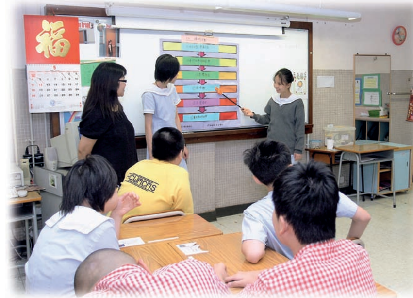
在老師引導下，由小組能力較強的學生帶領較被動的同學進行討論，再回答老師的發問。

她更強調，由於學生的適應能力較弱，為了讓學生的學習達到最佳效果，家長的合作是非常重要的。為此，學校除定時與家長溝通外，還會協助家長瞭解「圖像組織」的教學方法，以便家長也可以利用圖像幫助子女溫習。在生活技能方面，家長亦會按照老師教授的程序協助子女學習如煮食程序等，