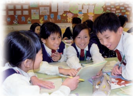
學生透過「合作學習」，互相分享學習心得。

以建立共融校園文化為起點，成功地開展到學與教的範疇。透過「合作學習」及「小步走」的教學策略，有效地促進學生主動學習。