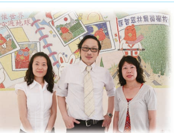
三位獲獎老師希望透過日常生活的訓練，提升自閉症學生主動學習的能力，建立被人接納的形象。

全面關顧自閉症學童在不同的成長階段及各方面的需要，建立層次分明的校本課程——由入學前至畢業後的全人發展及支援。