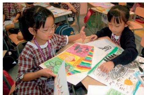
小一學生與同儕商討作品作檢視

藝術評賞對小學視覺藝術課程十分重要，因為在評賞過程中，可培養學生的審美及分析能力，因此我在每堂課節中加入不同形式的評賞活動，讓評賞帶動創作，使創作內容更可觀。例如：學生在課堂上以小組方式一起討論評賞的重點後，我引導學生進行歸納及分析，教授他們評賞技巧，然後檢視和修正自己的作品。學生完成創作後，課室會變成小型展覽室，學生以觀眾身份觀賞同學作品，並就同學作品作出評鑑。讓學生學習互評，可分析自己強弱之處，從而作出改善。我深信透過課堂上不同形式的評賞活動，能帶動學生進行創作，亦能提升學生的分析能力，對於小學生的成長有深遠的意義。