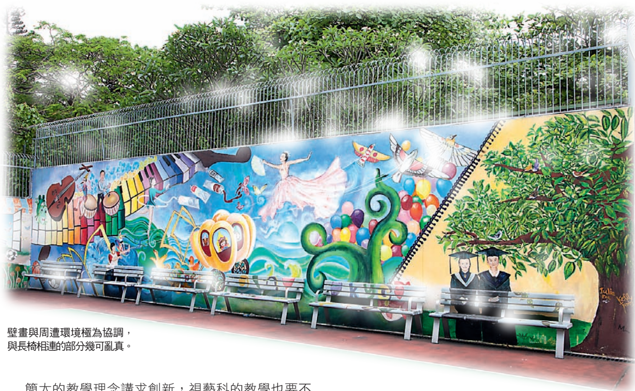
壁畫與周遭環境極為協調， 與長椅相連的部分幾可亂真。

Compendium of the Chief Executive's Award for Teaching Excellence