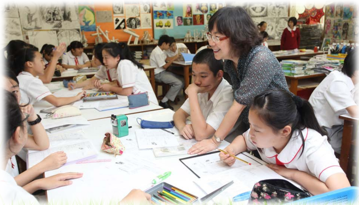
學生正在討論如何在舊設計上注入新元素

孔老師除積極推動課程改革工作，亦樂於將個人經驗與本地及內地教師分享，交流意見、開拓視野；同時舉辦工作坊，為家長介紹藝術創意教育對孩子成長的重要性，推動藝術教育普及化。