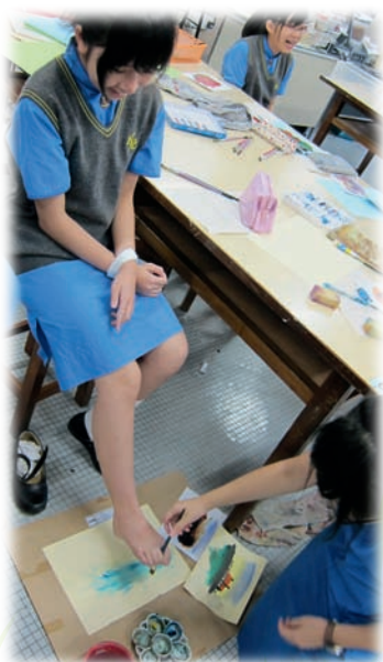
用腳來畫畫，效果雖然未必理想，但能體驗失去雙手的艱苦。

就如划艇比賽或陸運會的攝影作品，學生在拍攝動感相片之餘，也要為相片創作新詩或撰寫反思短文，「短文或新詩加強了學生的中文表達能力，也令學生對自己的作品有反覆的回味，確保他們對作品有更深切的體會。」