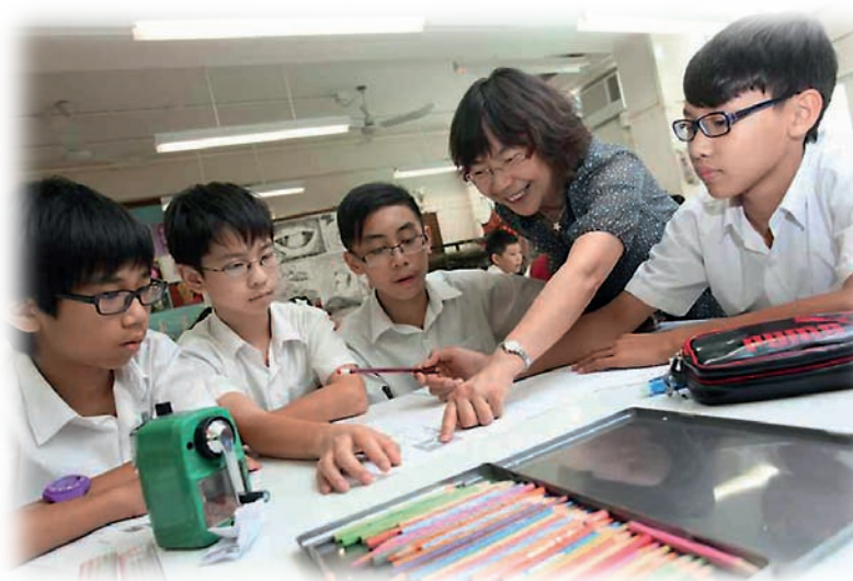
孔老師扮演同行者角色，輔助學生學習藝術知識。

後來我發現這種教學模式和當時在外國推行的「DBAE」藝術課程理念不謀而合。這個經驗給我很多的體會：