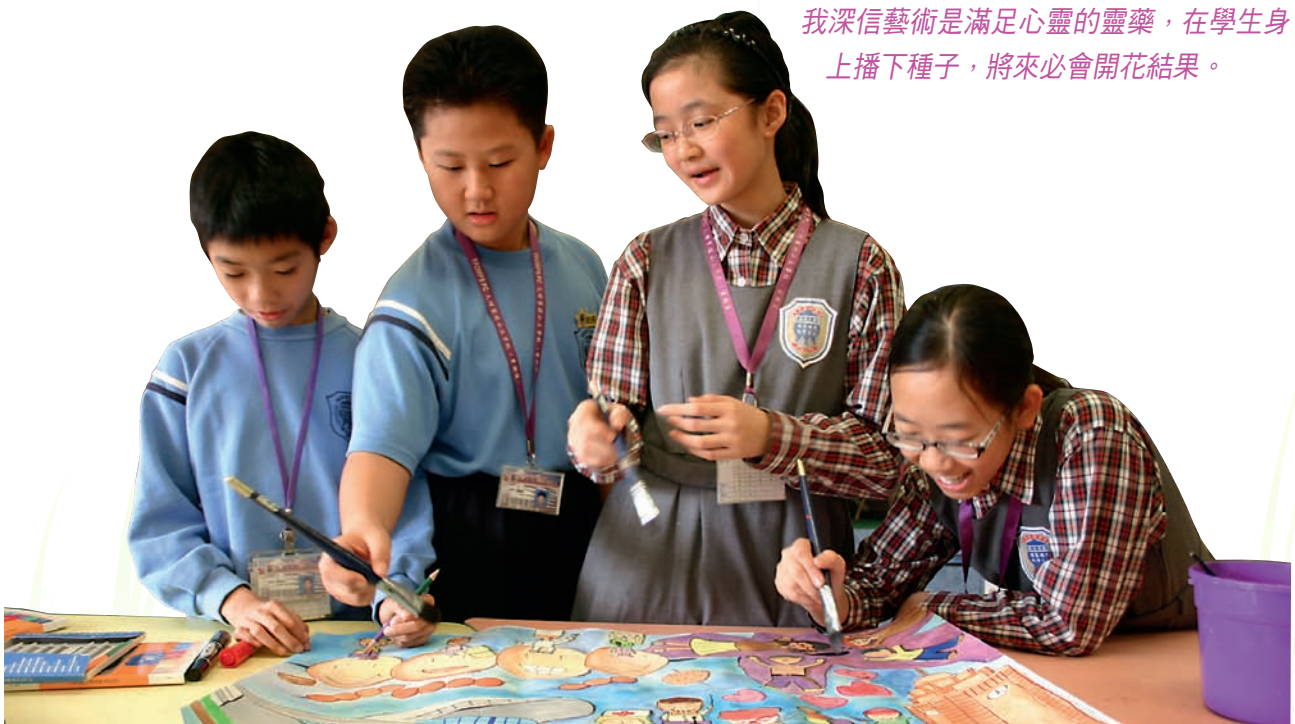
學生群策群力，合力完成作品。

經過幾年的教學實踐，我感到在小學推展視覺藝術教育的道路並不容易。教師常常面對不同的挑戰，但當看到學生對視覺藝術的熱愛，在藝術學習過程中表現的自信心，對我有着很大的鼓舞，亦肯定自己的努力。我深信藝術是滿足心靈的靈藥，在學生身上播下種子，將來必會開花結果。