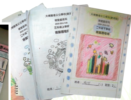
低年級視藝歷程冊