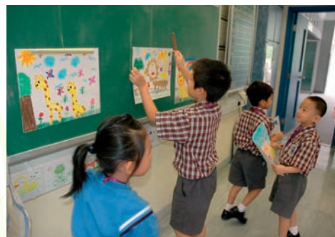
學生將自己的作品展示於黑板上