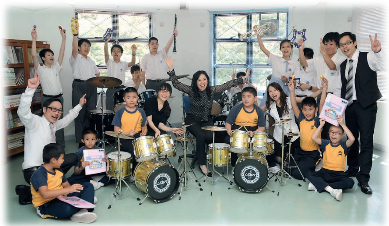
學校的管樂團經常有表演機會，令學生建立自信。

Compendium of the Chief Executive's Award for Teaching Excellence