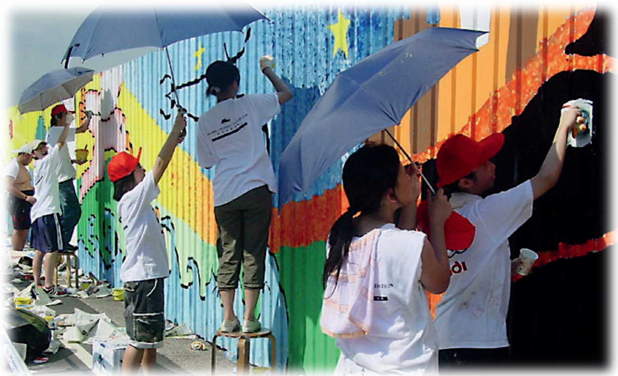
學生參與戶外壁畫創作，發揮個人創意。