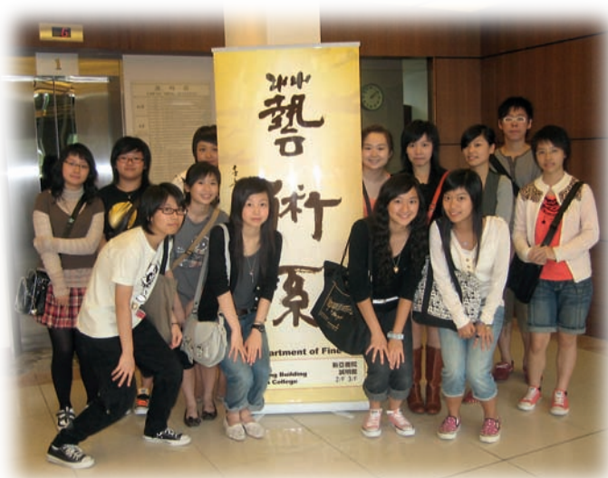
安排學生參觀香港中文大學藝術系，了解大學課程發展。

與其他傑出教師一樣，孔老師具好學不倦的精神。為追求專業發展，她於九十年代遠赴美國進修藝術教育碩士課程。她不諱言這次進修擴闊了個人藝術