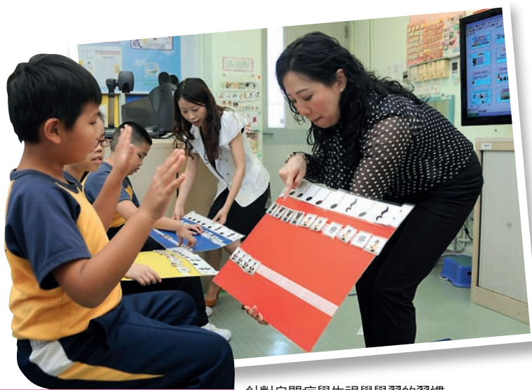
針對自閉症學生視覺學習的習慣，老師製作了很多色彩繽紛的教材，協助學生了解複雜的概念。

音樂是世人的共通語言，任何小朋友聽見動人的樂章，都會隨着節拍聞歌起舞，學習演奏音樂更可發揮獨特的潛能。只要方法得宜，自閉症學生也可學習音樂。匡智翠林晨崗學校五位教師，為了讓程度智障兼自閉症學生發揮音樂的潛能，合力在多元智能課採用了不一樣的教學策略，讓有學習障礙的學生也可享受優美旋律帶來的歡愉，並透過大量外出表演，建立學生的自信心。