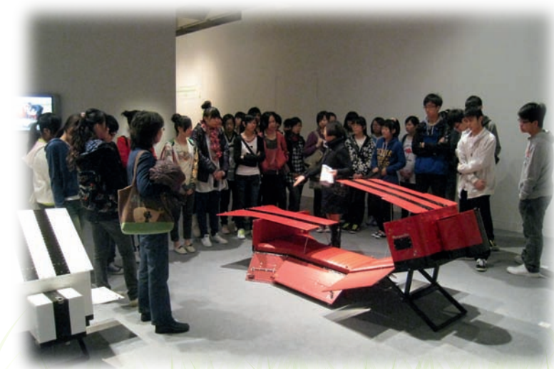
學生透過參觀藝術展覽，提升評賞能力。