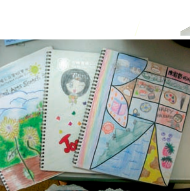
高年級視藝歷程冊

我的教學強調視覺思考(Visual Thinking)，故特別設計視藝歷程冊輔助學生學習，並評估學與教的成效。我引導學生將言語化為圖像，以圖像說故事，進行草圖、試驗及資料分析，然後開始創作；而學生在創作中段或完成後，都會在歷程冊上進行反思、個人或同儕評賞。我將視藝歷程冊配合課堂活動，學生在冊上進行不同的試驗，表達他們對不同藝術家、同儕及自己作品的看法，有系統地運用相關詞彙作分析，為日後評賞打好基礎。