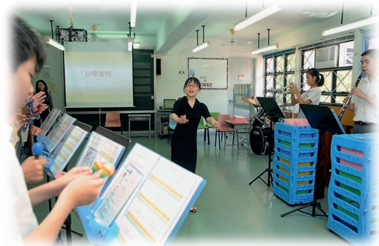
在老師指揮下，學生透過演奏樂器，訓練社交與協作的能力。

我們早在 1998 年獲得優質教育基金撥款，成立香港首隊由智障學童組成的管樂團 MIB(Music-in-born)，為他們創造表演平台，對推動智障兼自閉症學童音樂教育，意義重大。