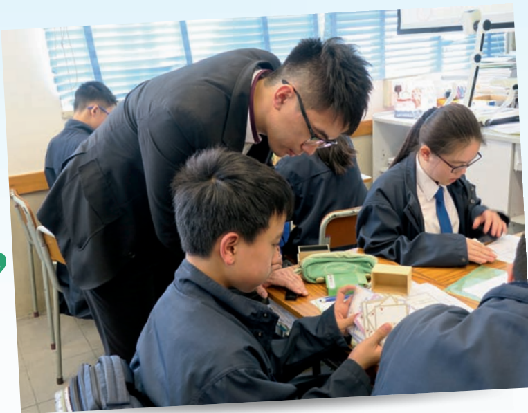
▲學生透過課堂學習活動，反思自己的能力。

小組教師有策略地培訓學生成為同儕的先行者，建立生涯規劃小組、校園電視台、生涯規劃大使等學生團隊，讓學生發揮朋輩的影響力，甚具校本特色。學生可通過「我的寶庫」和電子版的活動記錄，訂立或修訂生