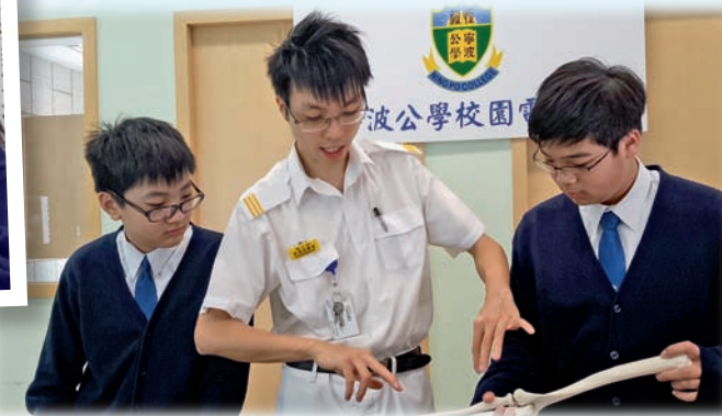
▼物理治療師到學校分享和示範日常工作

是，讓學生學會先「停一停，想一想」，檢視目前自己的狀況和思考未來，為自己的人生作出明智的抉擇。