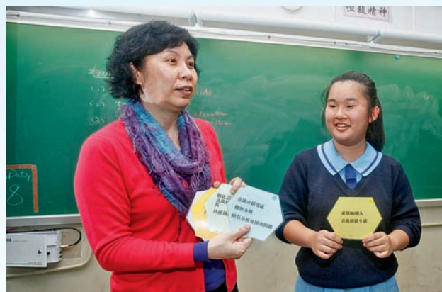
▲學生在課堂上介紹自己的強項

要求學生運用「能力強項卡」了解自己具備的能力。學生透過此活動，加深認識自己的強項。曾有學生被同學評為具創意和表達力強，自此信心大增，主動要求參加科學比賽，以證明自己的能力。結果，他在全港200個參加科學比賽的學生中排名50，成績不俗。若沒有同學的鼓勵，很可能埋沒了他的天分。後來該學生經常參加科學比賽，並獲得不少獎項，更擔任校內及聯校活動的司儀。呂老師直言：「我們的目標就是在課堂上創設機會，讓學生認識自己，再搭建一個平台，讓學生經歷成功，建立自信，發放閃耀光芒。」