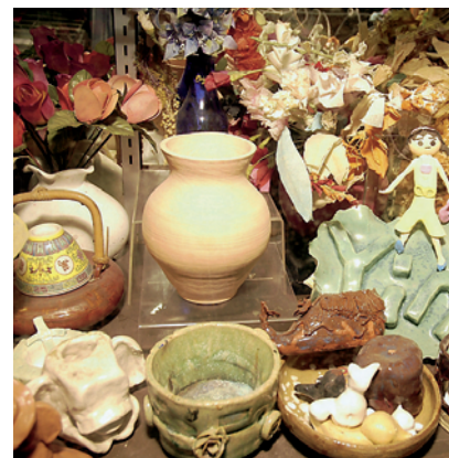
學生作品多元化，陶藝作品便是一例。

學生獲得讚賞是個人學習過程中的重要推動力，視藝科老師透過不同渠道展出學生的作品，以鼓勵學生創作。例如將