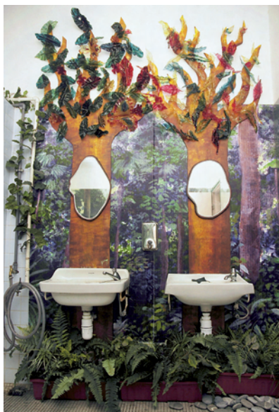
師生透過與藝術家合作，以熱帶雨林為主題，共同美化校園洗手間。

以中一級為例，鑑於學生來自不同的小學，程度不一，因此，老師會先教授他們基本的創作技巧，以拉近學生之間的距離。為配合新高中課程的推行，自2006年起加入評賞元素，教授學生評賞藝術的技巧。此外，去年就以和路迪士尼卡通人物為主題，引導學生先選定一個他們喜歡的卡通人物，從欣賞到認識造型的演