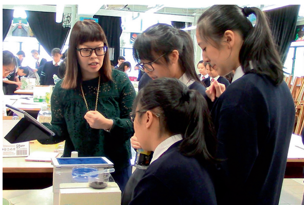
▲「水溝油」提供不同媒介的創作經驗，增強表現力與創意。