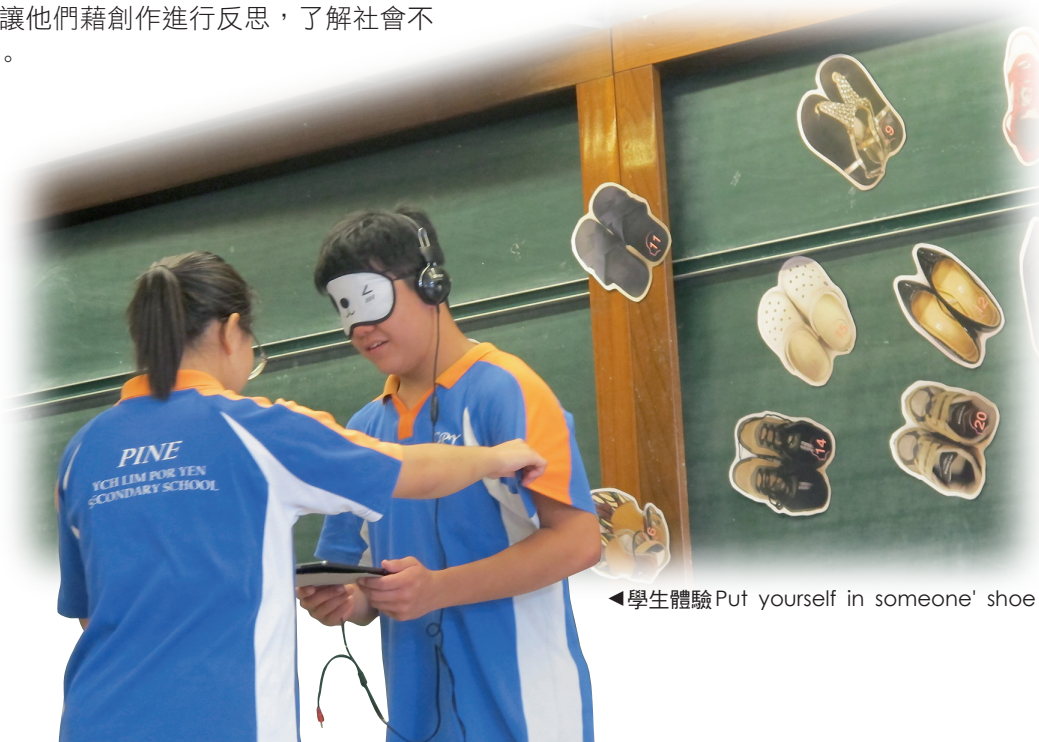
◀學生體驗 Put yourself in someone's shoe

為了豐富學生的學習體驗，我們舉行了一連串配合「世·人·情」單元的體驗式學習與創作活動，以鞏固學習成果。為了進一步誘發學生的同理心，我們又將美術室轉化為同理心體驗館，讓師生體驗 Put yourself in someone's shoe 的活動，學生收集校內不同持份者的一雙鞋並輯錄一段感言，分享各人所面對的困難和感受，讓參與活動的同學邊穿上展出的鞋子，邊聆聽該鞋子主人的心聲。藉角色代入、易地而處，讓學生代入他人身份所面對的困難與感受，學習換位思考，促進包容互諒。