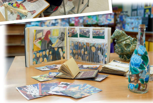
▼學生利用不同物料創作，發揮創意，作品多樣化。