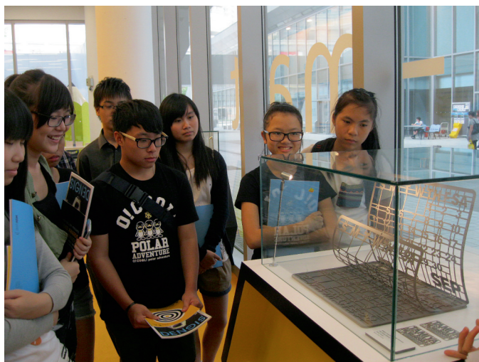
▲透過全方位學習，學生真確體驗藝術參與的樂趣。

為了回應學校三年計劃中的關注事項：培養學生的同理心，我主動聯繫通識科、德育及公民教育組及本校的社會服務委員會，發展學習單元「世·人·情」。以本土貧窮的問題為創作題材，引發學生反思貧窮兒童與麥難民、劏房戶等社會現象，並按自身對情境的體會，進行創作。我喜見同學能以線描表現香港社區貧窮的獨特情境，或運用明亮色彩勾畫對貧窮人士帶來支援與希望的期盼，或選用沉鬱色調繪畫一眾被漠視的社區隱形人，作品頗具感染力及真實感。我深信這類結合價值觀教學的生活題材，除了能令學生對周遭的人和事產生同理心和共鳴外，更讓他們藉創作進行反思，了解社會不同階層的處境。