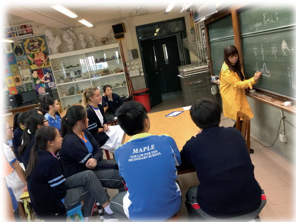
▲與視藝科海外交流生進行圖意傳訊遊戲

抱持上述理想的楊老師，除了善用多元化的教學策略配合學生學習需要外，亦能因應校情和學習情境，在視覺藝術科推行主題式單元學習，強調評賞帶動創