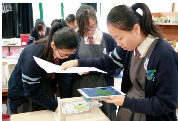
▲學生嘗試以水溝油進行藝術創作

最後是一位慕名到校選修視藝的學生，學生曾於同區學校就讀中四，為選修視藝科而轉校重讀，結果