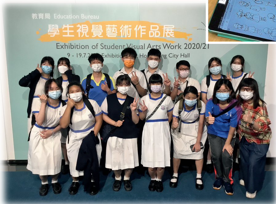
◀師生齊參與「學生視覺藝術作品展」