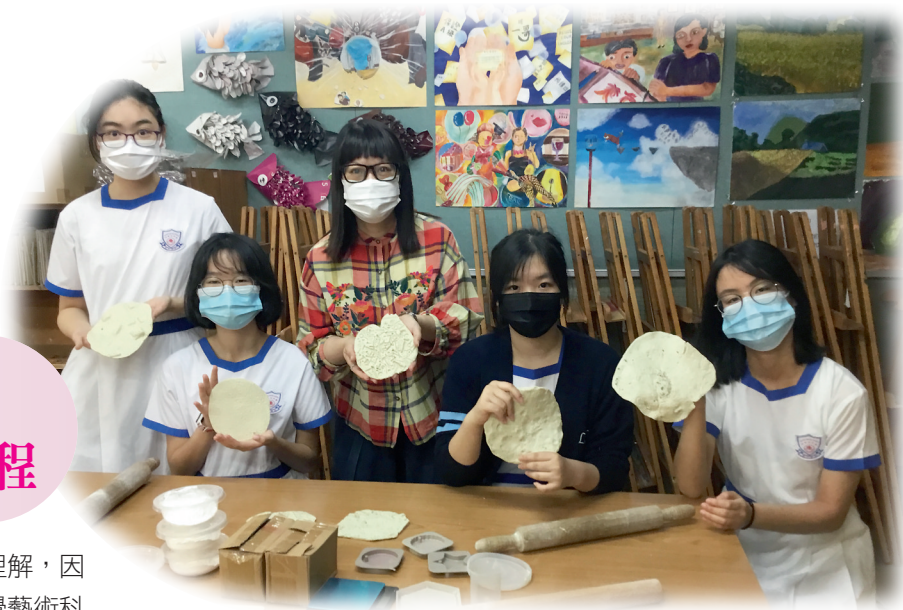
▲楊老師（中）與學生一起做印模

楊老師主動聯繫不同科組推展跨學科及跨領域學習，從而啟發學生的好奇心，培養他們對生活的觸覺，讓學生綜合運用各種知識和技能學習藝術；又利用高中藝術教育時段組織全方位學習活動，引發學生參與 STEM in Visual Arts 的學習興趣。為了培養學生成為具創新能力的競爭者，楊老師鼓勵學生以研習探究方式累積學習經驗及轉化知識；又策劃「同理心故事館」，藉展出學生相關的作品，培養學生正向的價值觀；更鼓勵學生參與藝術活動、校外展覽和比賽，即使在新型冠狀病毒病疫情中，楊老師仍善用學科網頁，發放藝術活動的訊息、展示學生的畫作，有效建立校內藝術文化。