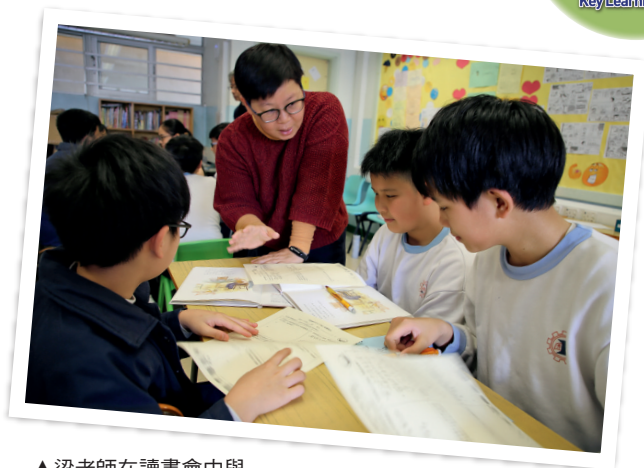
▲梁老師在讀書會中與學生交流閱讀所得