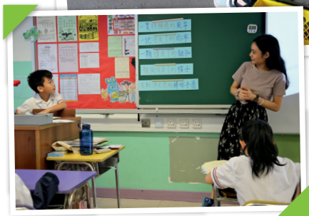
◀林老師以提問刺激學生思考