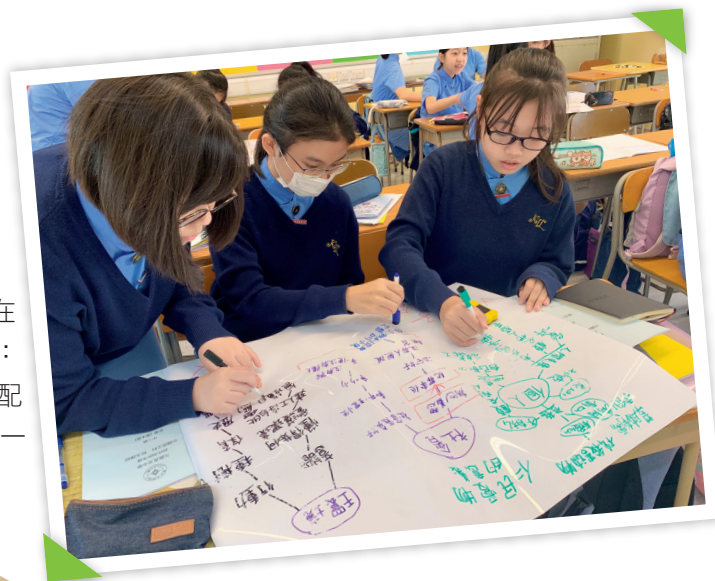
▲學生進行課堂討論，探討仁民愛物的意義。 ◀編訂校本教材，並持續優化。

在設計校本課程的過程中，選用教材、設計教案，要照顧學生的多樣性，我們在這些關節眼上難免碰釘子。因此，我們不敢懈怠，善用共備會議、課程大綱檢討會，持續優化校本課程。同時，為配合兩文三語政策，我們參加普教中計劃、內地與香港教師交流及協作計劃、語文教學支援組協作計劃，聽取學者、同業的寶貴意見，優化教材，將經典與生活結合，創設富趣味而具延展性的學習情境與任務，令學生感受文學源自生活的力量，體味中華文化永恆不朽的價值。