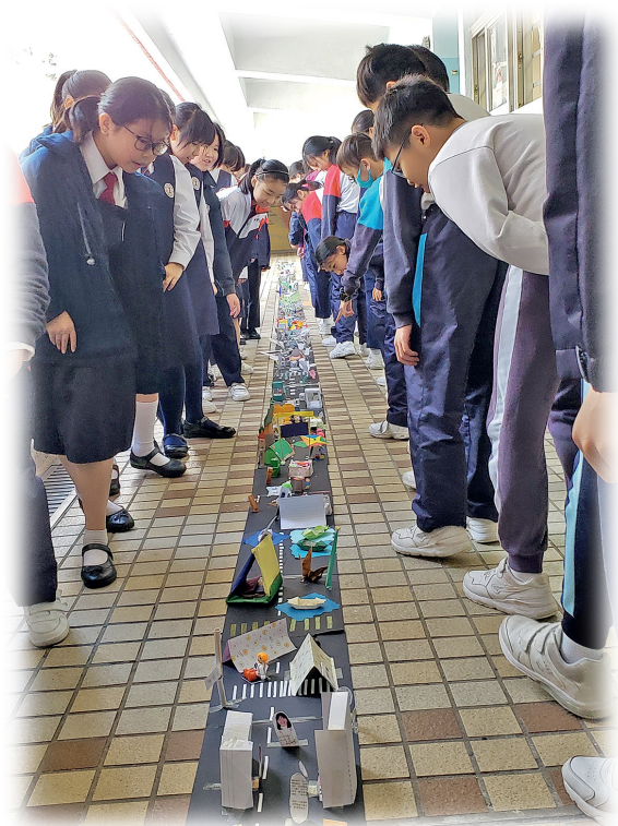
▲學生駐足欣賞跨課程閱讀課業——「無車日的馬路」

一次大膽的構想，竟帶來意料之外的收穫。「我們給予六年級學生每人一張白紙，事前沒有給予任何方向和指引，讓學生自由發揮，製作屬於自己的閱讀筆記。從學生提交的筆記看到他們運用了我們教授的技巧，如腦圖、故事圖式、向作者提問等，這反映了