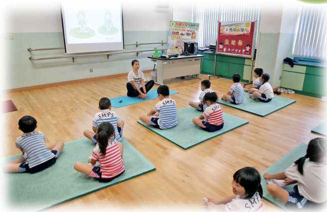
▲與體育科協作，推動跨課程閱讀。