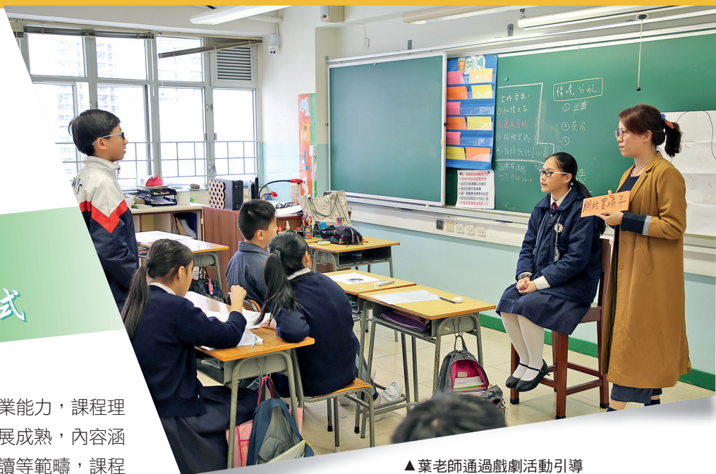
▲葉老師通過戲劇活動引導學生表達書中人物感受

觀課所見，「童書」選材恰當，能切合學生的興趣和能力，教學設計能落實 TiPS 閱讀教學模式，組織嚴密，學生的課堂參與度高，踴躍回答問題，能從閱讀中展現正面的價值觀，教學效果良好。小組教師的教學基本功扎實，教學表現優秀，課堂節奏控制得當，能夠維持濃厚的學習氣氛，提問和回饋的技巧俱佳，能夠照顧學生的多樣性。