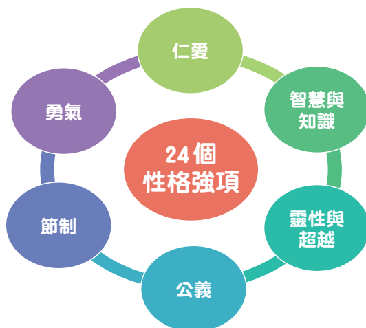
圖一：「繪本生命花園」童書課程框架

命花園」童書課程，更以「仁愛、智慧、勇氣、節制、公義、靈性」六種美德進行規劃，導引學生代入不同情境與角色作多角度思考，從而確立正面的價值觀。以二年級一個用「情緒管理」作主題的教學設計為例，教師以靈活多變的閱讀活動讓學生掌握內容重點，代入情境反省自身，體會到控制情緒才能與人溝通，建立良好關係。而引導學生進行閱讀回應是延伸學習的關鍵，我們創設情境，讓學生聚焦思考，以圖文或書寫的方式，自由表達個人見解；通過分享匯報，促進同儕交流。看到學生全情投入、主動分享，有時更真情流露，對語文學習的喜愛不言而喻，實在令我們萬分欣慰。