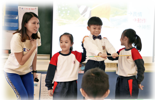
▲何老師運用戲劇習式——定格引領學生代入角色思考

「校本童書課程」是我們教師團隊歷時十年規劃的閱讀課程。童書，是我們在學生身上播下的種子。由萌芽到探索，由逐步發展至漸趨成熟；以閱讀教學為起點，再延伸至寫作、品德情意等學習範疇，甚至是跨學科課程規劃。我們通過開放式的選材及系統化的閱讀模式，提升學生閱讀深度，拉闊思考空間，養成良好品格。