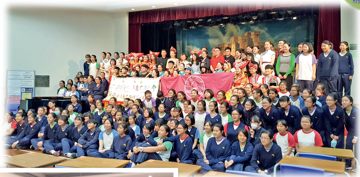
▲廣西師範大學藝術交流團訪校，進行文化交流。 ◀利用電子學習桌自學文化知識