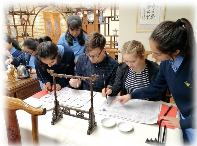
▲推廣書法藝術，弘揚中華文化。

在建設電子學習平台的經驗上，我們再得到優質教育基金的支持，開拓中華文化基地「德馨學舍」。「德馨」二字寄寓了對學生敦品勵行的殷切期許。我們於初中普通話科設計文化體驗課程，學生在古色古香的學舍中學習書法、茶道和棋藝，從實踐中培養審美情趣，陶冶性情。此外，我們舉辦各種體驗活動，