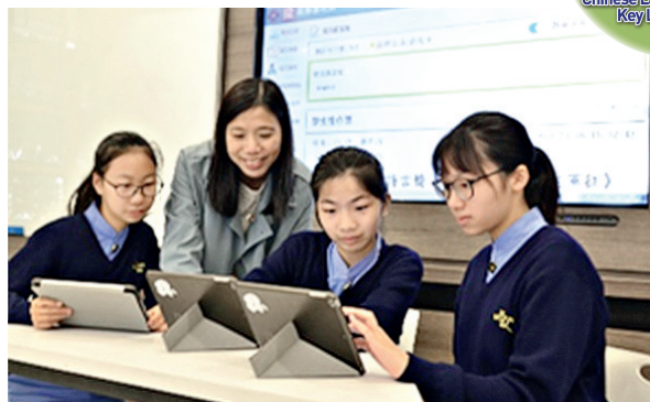
▲創設校本電子學習平台，鼓勵學生自學。