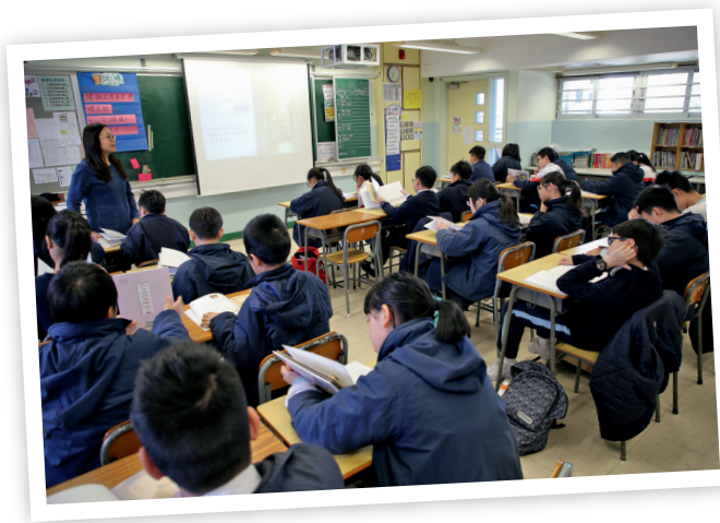
▲鄧老師以問促思，引導學生思考童書內容。

除了設計閱讀筆記，團隊教師又嘗試規劃「跨課程閱讀」，過程中積累了不少寶貴的經驗。梁老師說：「推動閱讀看似是中文科教師的職責，如何與其他學科結合？過去我們曾與視藝科合作，難度在於視藝科老師未必了解中文科在教授閱讀時的內容重點，我們也不確定學生在藝術創作上的能力。」故此，兩科教師事前須做好溝通，視藝科教師知道創作要求後，便會評估學生是否力所能及，再給予建議。