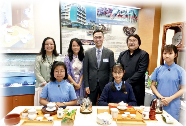
▲學生學以致用，校慶日泡茶奉客。

在古色古香的氛圍中學習是難得的體驗，大受學生歡迎。「他們一到德馨學舍，舉止瞬間變得更文雅。泡茶者要心靜，泡一杯茶約需三分鐘，但全程要保持專注，控制水壺高沖細流，很考功夫，不少學生更泡出興趣來。部分平時較被動的學生，在茶藝方面卻很出色，我們邀請她們在校慶時為嘉賓泡茶，深獲讚賞，令其自我形象大大提升，建立成功感！」