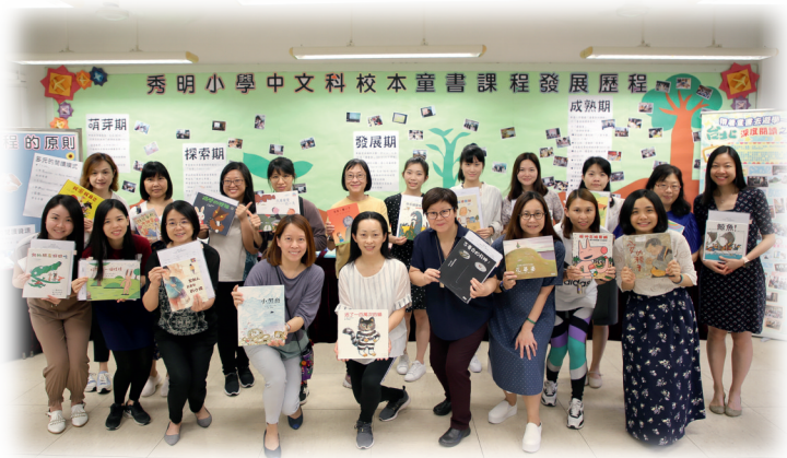
▲十年耕耘，樹木樹人。

十年耕耘，果實纍纍。學校的風景變得不一樣了——我們案頭上的童書比教科書多，學生拿着童書讀得津津有味，師生為了交流閱讀所得，渾然不覺小息鐘聲已響起……我們所收穫的已不只是豐富而堅實的校本課程，師生分享的也不單是書本內容，還有真情、良善和美德。期盼我們在學子心中埋下的小種子能繼續生根發芽，為稚嫩的心靈結好一張溫柔的網，伴隨他們健康成長。