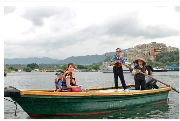
▲安排探訪水上人家的親子活動，讓學生親身體驗書中人物搖櫓的感受。