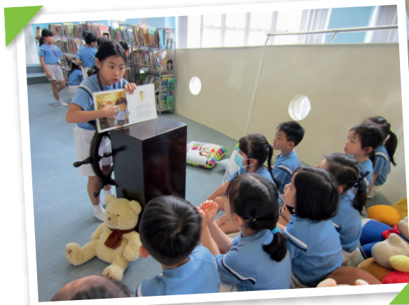
▲學生以講故事形式，分享書中內容，其他同學用心聆聽。

全校教師及家長踴躍買書及捐書，部分學生更會用『利是錢』買心頭好，全校充滿愉快的閱讀氣氛。」