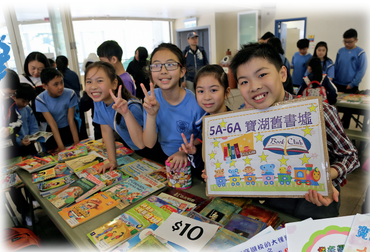
◀學生積極參與寶湖舊書墟活動